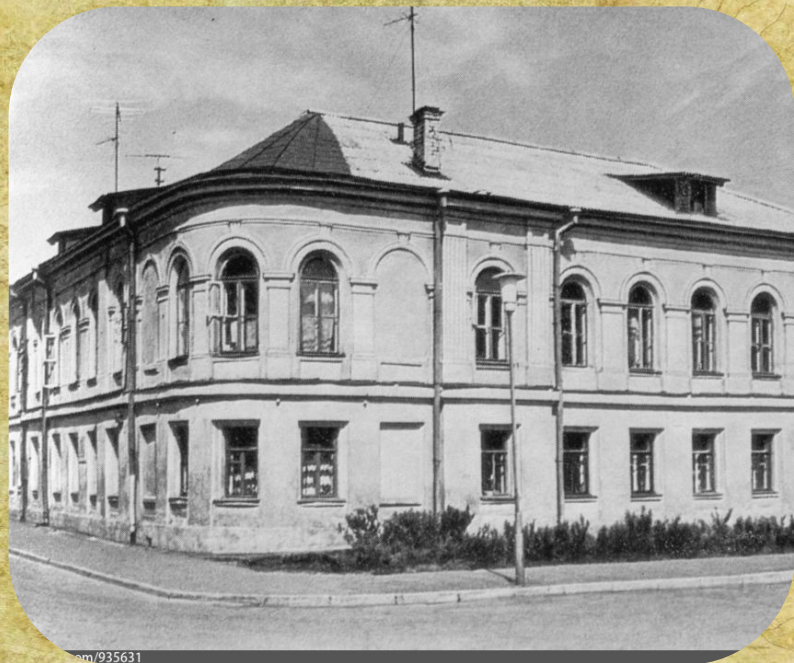
Здание дома-музея Салтыкова-Щедрина 1975-1976 год

Салтыков-Щедрин прославился своими произведениями, которые стали памятниками классической русской литературы. Годы службы в Твери сыграли важную роль в творчестве писателя. Тверские впечатления нашли отражение на страницах его многих произведений. Это «История одного города», «Пошехонская старина», «Господа Головлёвы», «Помпадурсы и помпадурши».