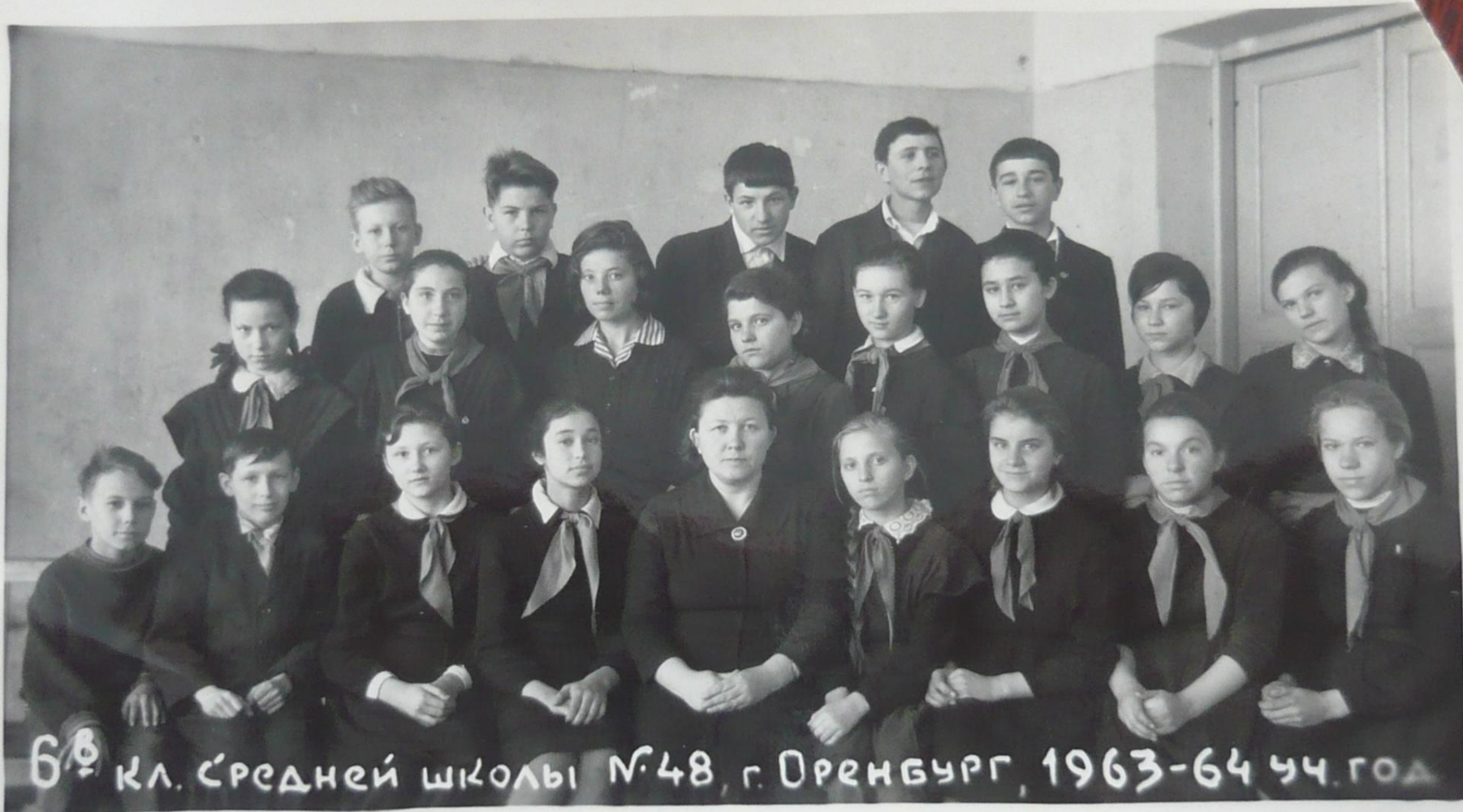
6 Б кл. Средней школы №48, г. Оренбург, 1963-64 уч. год