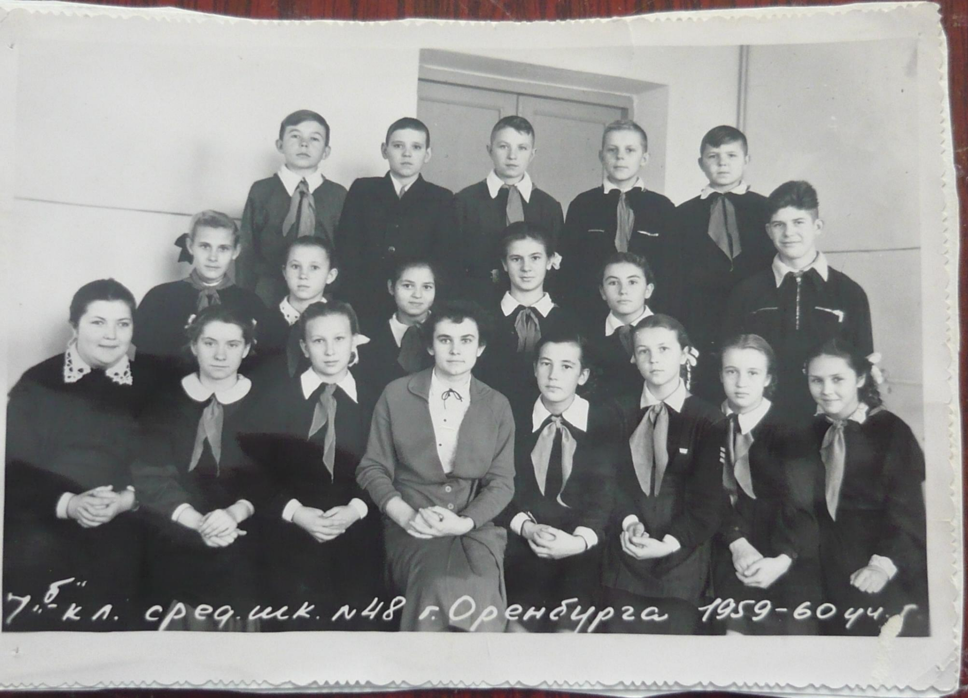
7 б кл. сред. шк. №48 г. Оренбурга 1959-60 уч.