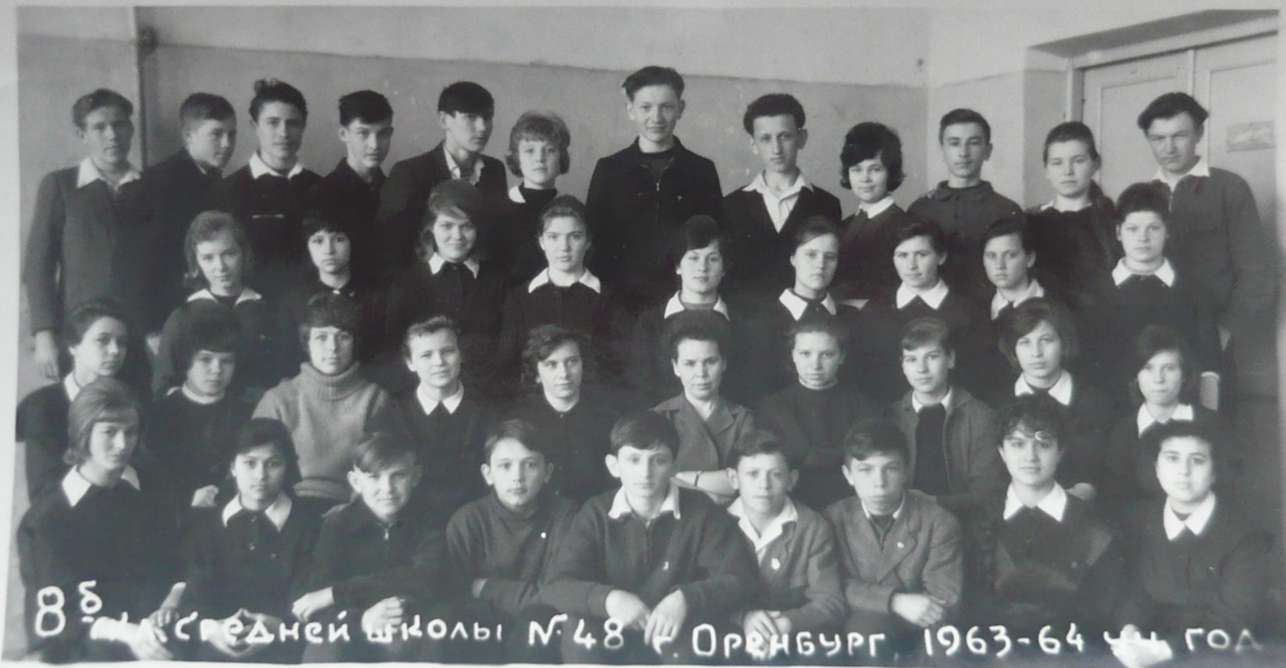
8б класс средней школы №48 г. Оренбург 1963-64 уч. год