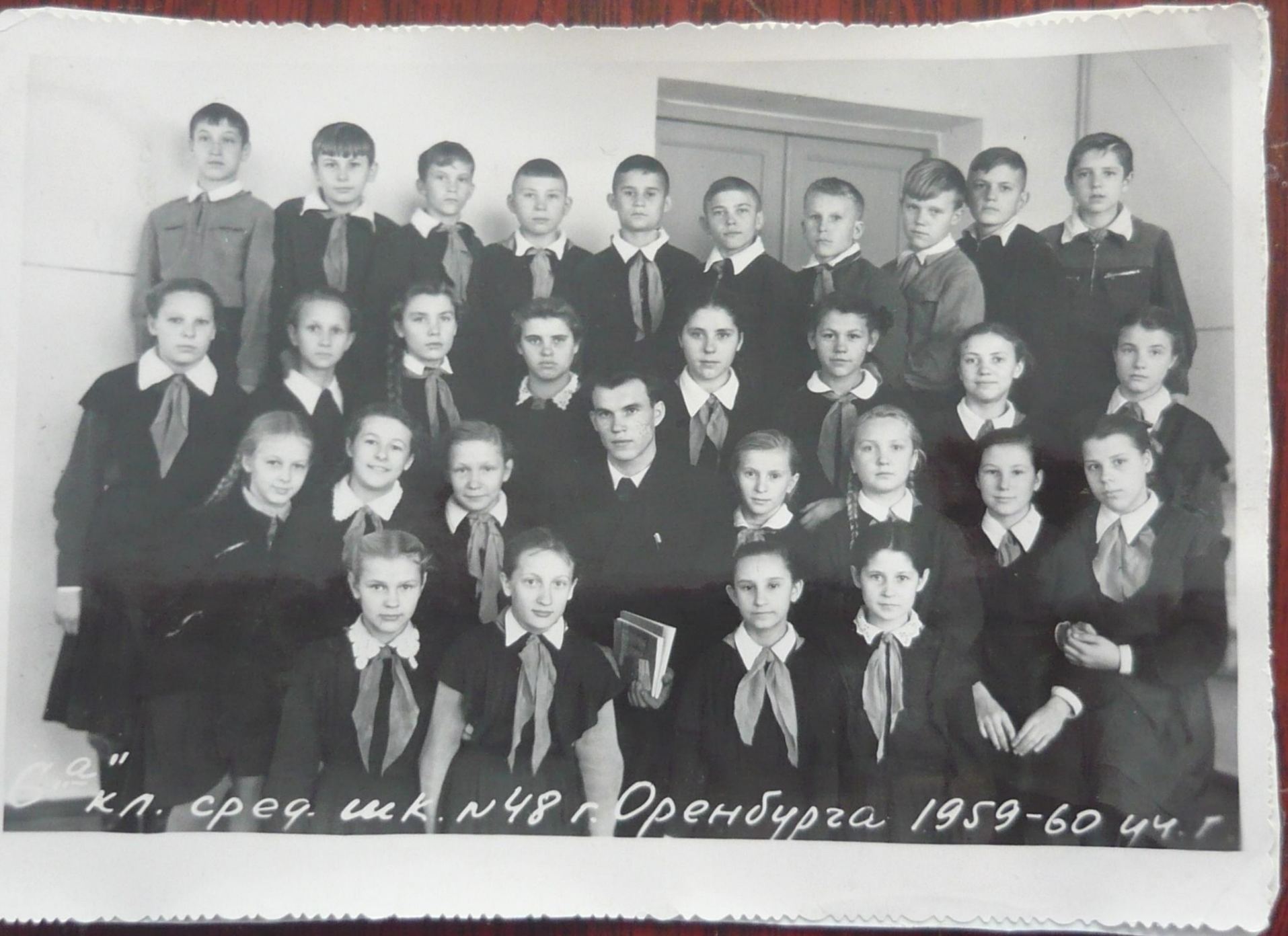
5 а" кл. сред. шк. № 48 г. Оренбурга 1959-60 уч. г.