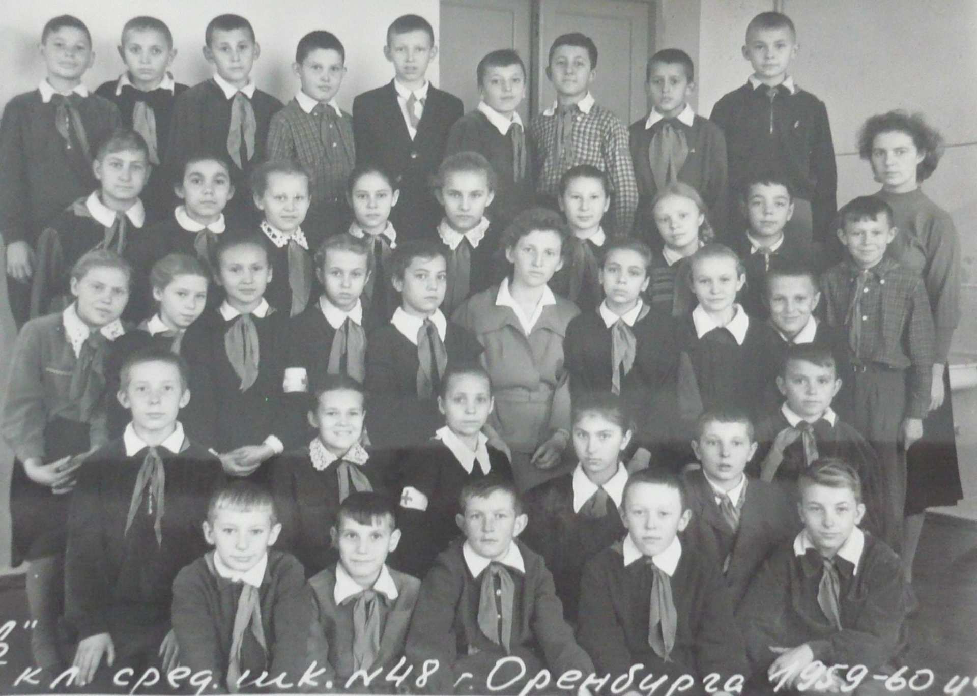
к л. сред. шк. №48 г. Оренбурга 1959-60 уч