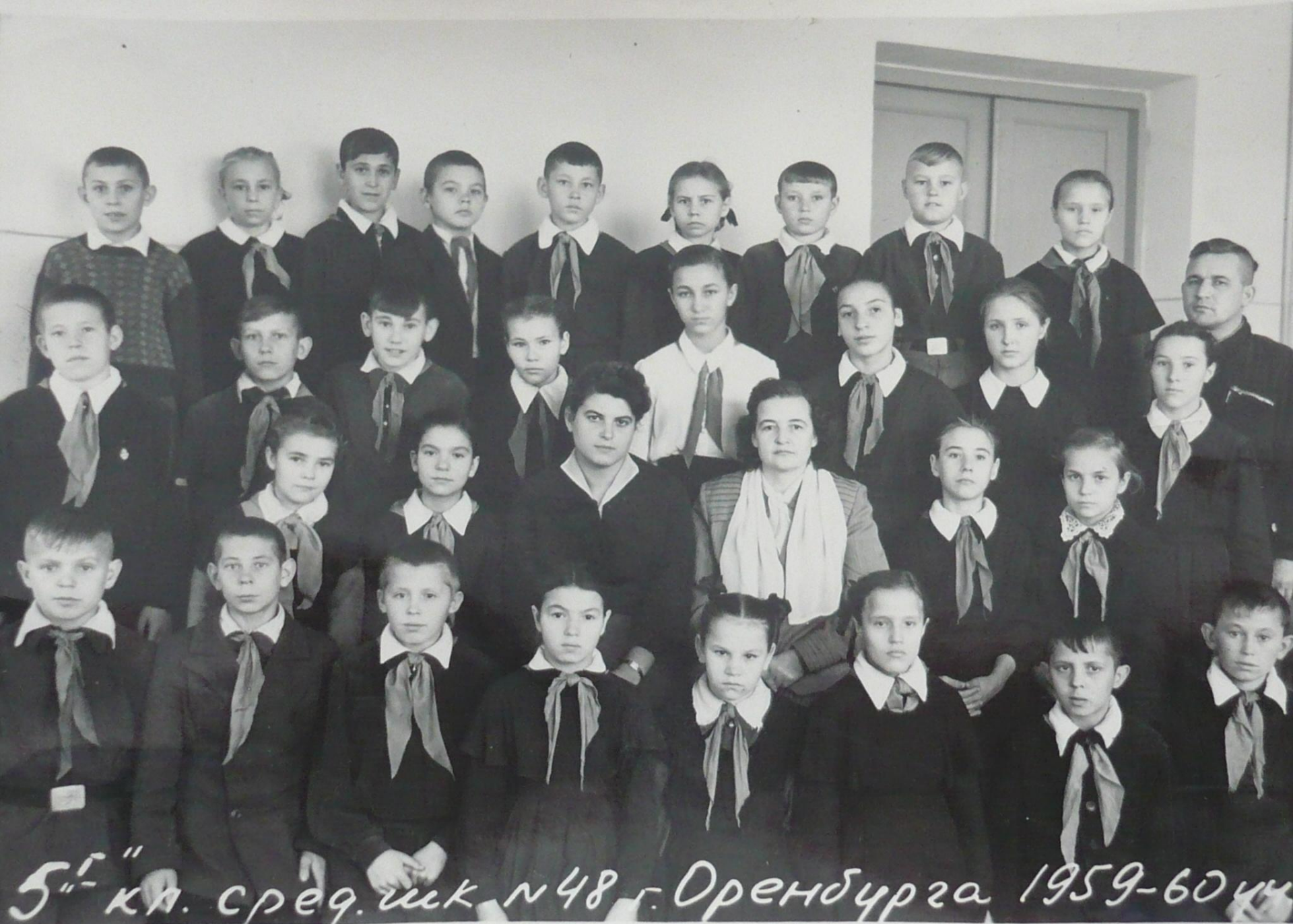
5-й кл. сред. шк №48 г. Оренбурга 1959-60 уч.