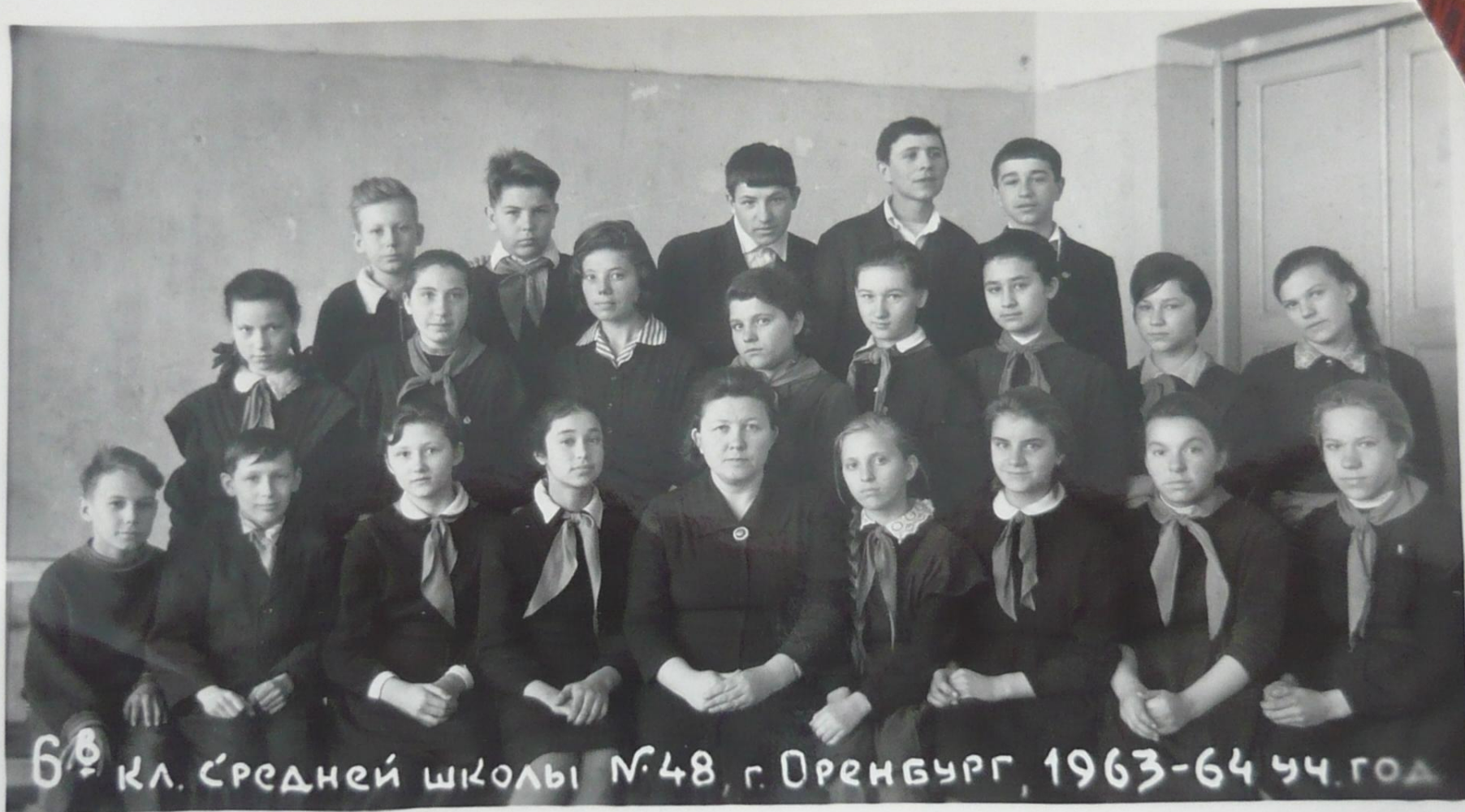
6 Б кл. средней школы №48, г. Оренбург, 1963-64 уч. год