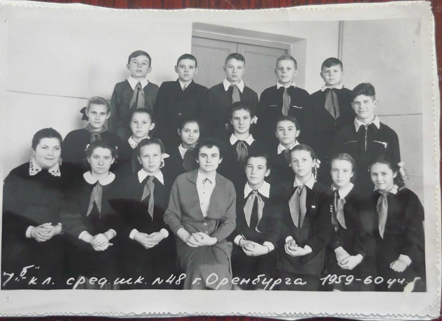
7 б кл. сред. шк. №48 г. Оренбурга 1959-60 уч.