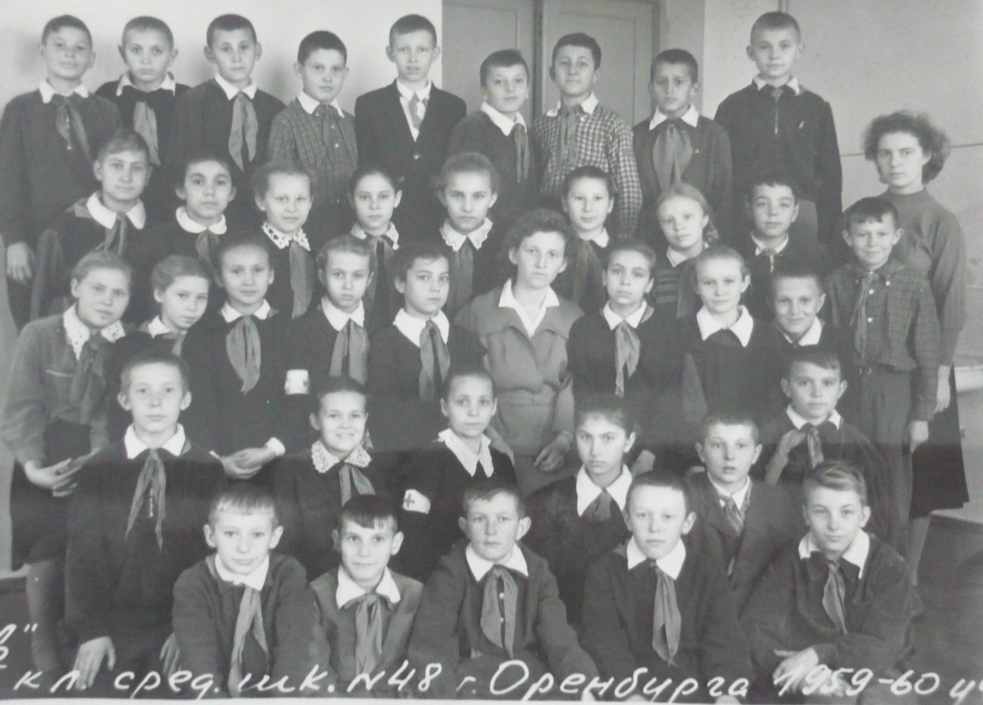
к л. сред. шк. №48 г. Оренбурга 1959-60 уч