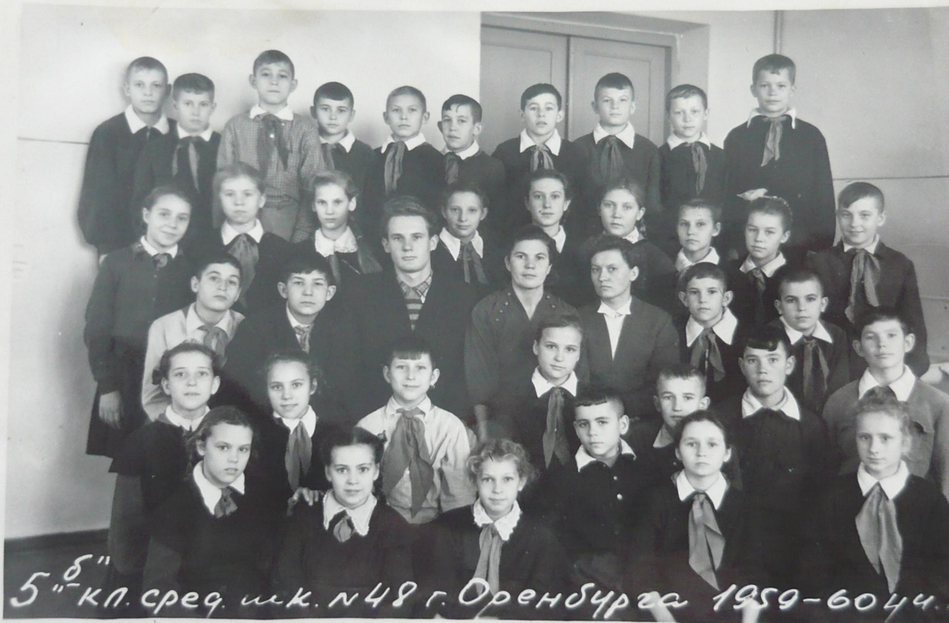
5 б " кл. сред. шк. №48 г. Оренбурга 1959-60 уч.