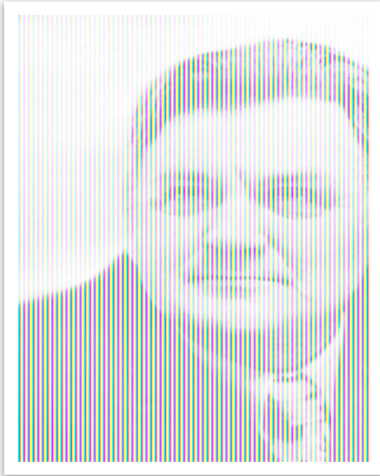
Борис Фёдорович Ломов (1927-1989)