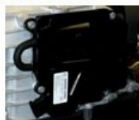
Интеллектуальный сервомодуль (ISM/DSM)