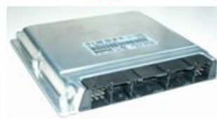
ESM только BR230/240