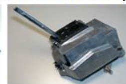
Интеллектуальный сервомодуль (ISM/DSM)