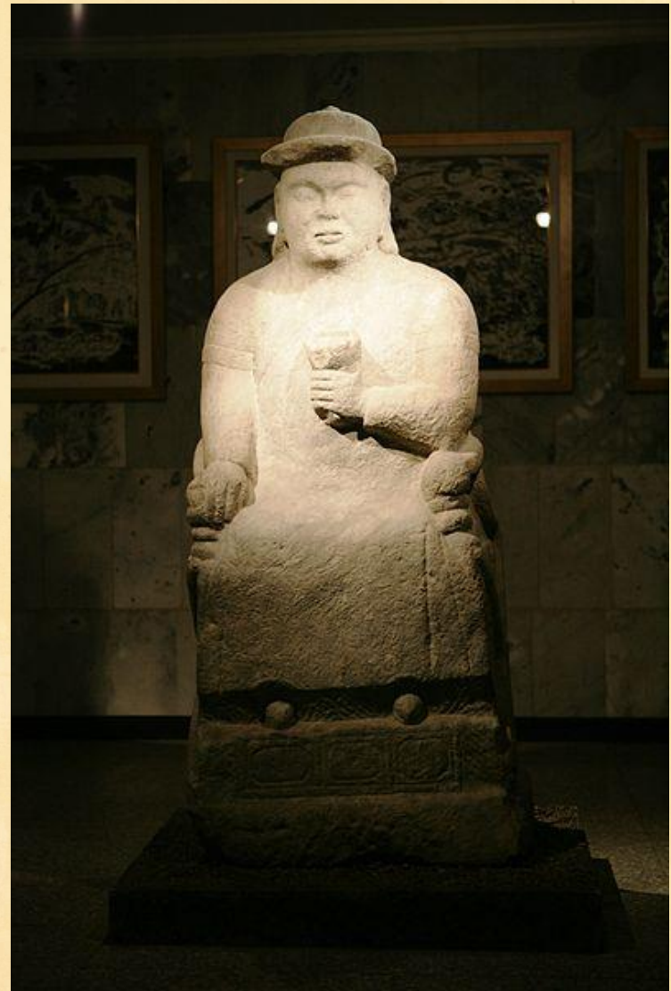
Кюльхан (монгольская статуя)