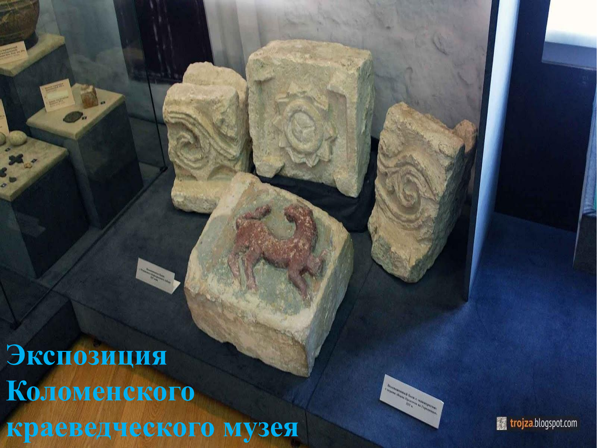
Амурская ваза с рельефом животного XV в.