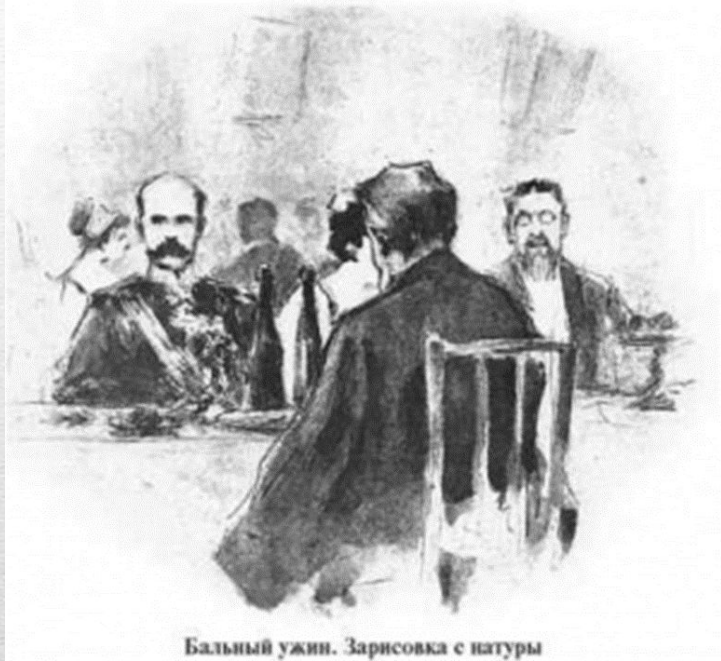
Бальный ужин. Зарисовка с натуры