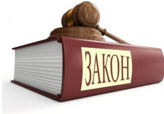
Реестр законодательных доплат и надбавок