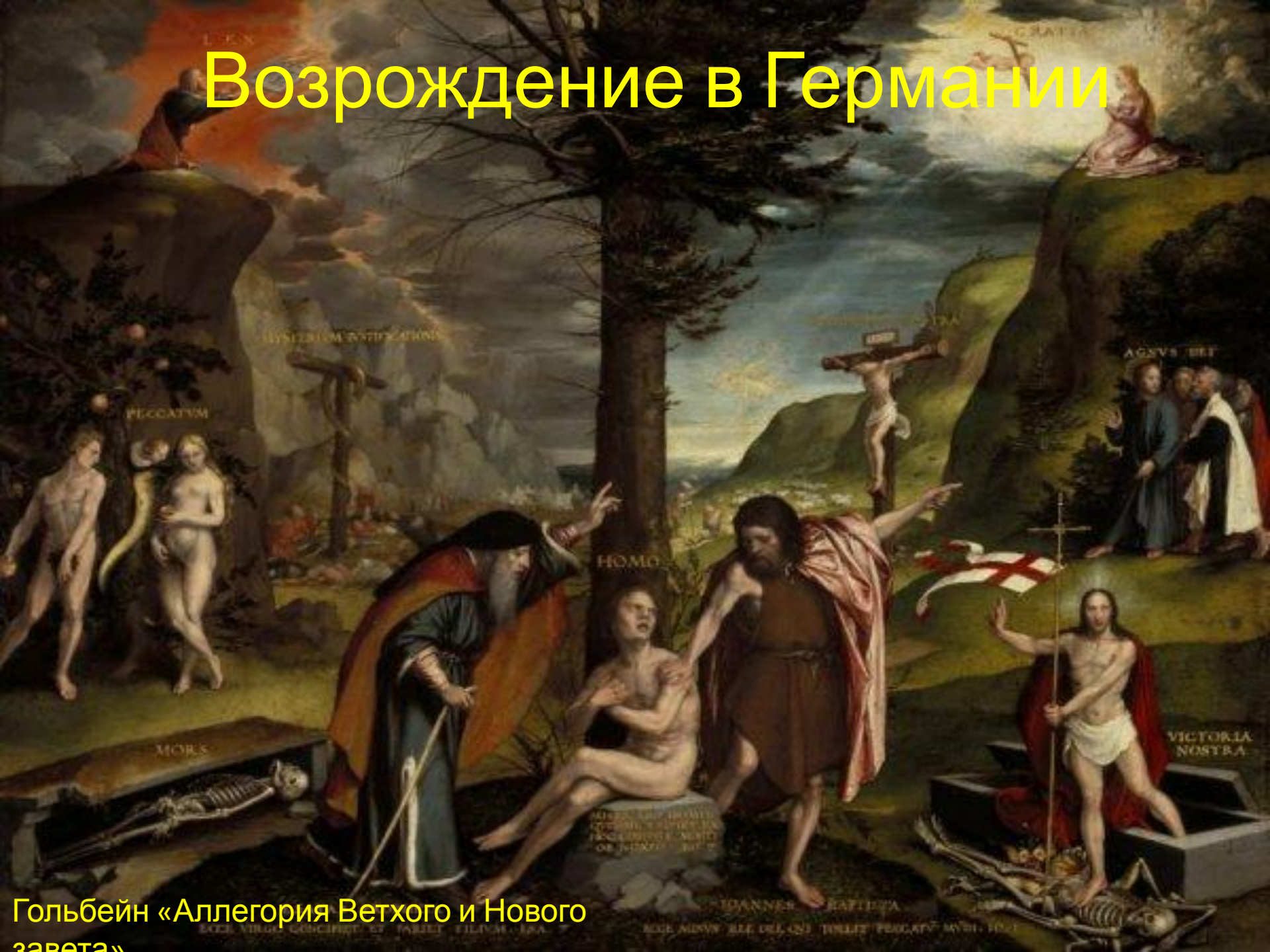
Гольбейн «Аллегория Ветхого и Нового завета»