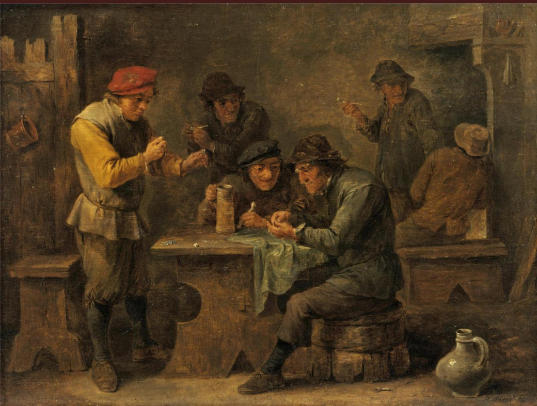
«Крестьяне, играющие в кости»

Его картина из жизни народных кабачников и постоялых дворов начисто лишены идиллического характера и полны юмора.