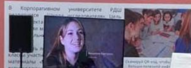
Семинары ОК «Исследования и инновации»