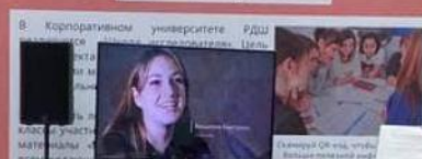
Семинары ОК «Исследования» и «Методика работы»