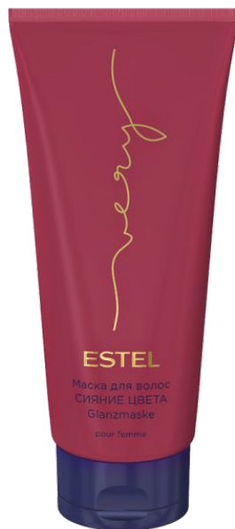
МАСКА ДЛЯ ВОЛОС СИЯНИЕ ЦВЕТА ESTEL VERY 200 мл арт. EV/M200

Подчёркивает богатство цвета и способствует его сохранению. Обеспечивает интенсивное увлажнение, наполняет волосы ароматом ESTEL VERY.