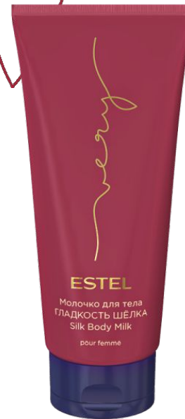
МОЛОЧКО ДЛЯ ТЕЛА ГЛАДКОСТЬ ШЕЛКА ESTEL VERY 200 мл арт. EV/200

Нежно очищает и увлажняет кожу. Придаёт ей мягкость кашемира. Оставляет на коже вкус аромата ESTEL VERY.