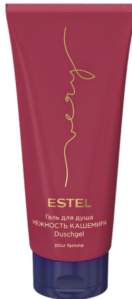
ГЕЛЬ ДЛЯ ДУША НЕЖНОСТЬ КАШЕМИРА ESTEL VERY 200 мл арт. EV/G200

Применение: нанесите на чистые влажные волосы, оставьте на 5-10 минут, смойте.