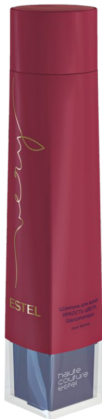
ШАМПУНЬ ДЛЯ ВОЛОС ЯРКОСТЬ ЦВЕТА ESTEL VERY 250 мл арт. EV/250

Подчёркивает богатство цвета и способствует его сохранению. Обеспечивает интенсивное увлажнение, наполняет волосы ароматом ESTEL VERY.