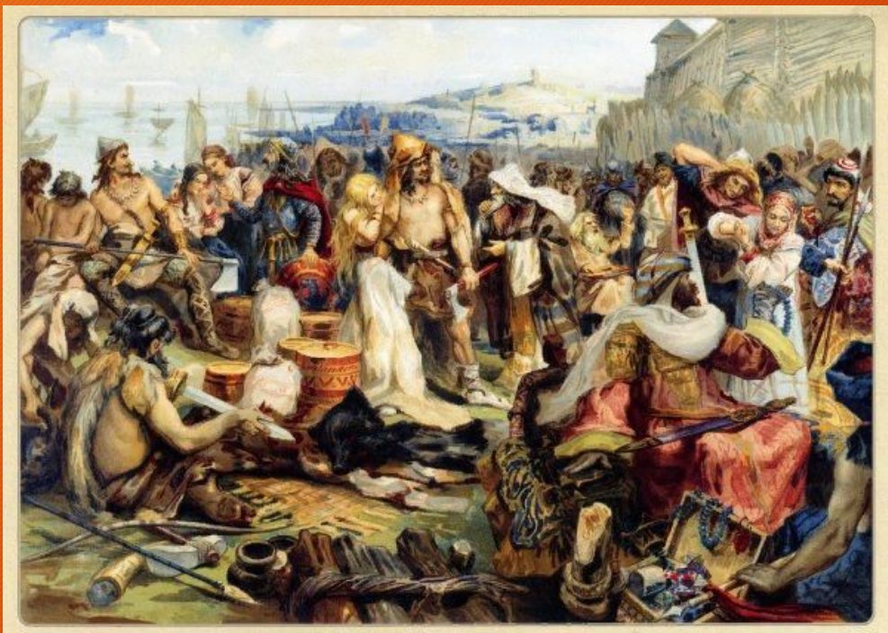
Неизвестный художник - «Торг у древних славян»