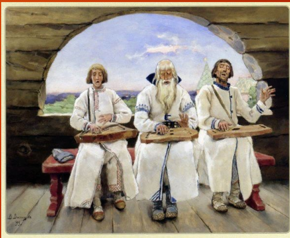
Виктор Васнецов - «Гусляры»