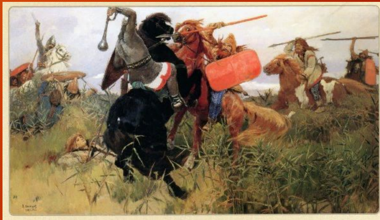
В.М. Васнецов - «Бой скифов со славянами» 1881 г.