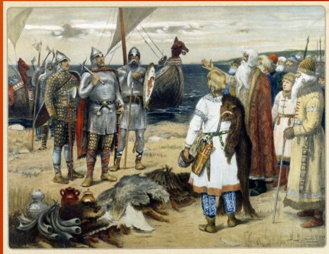
В. Васнецов - «Варяги»