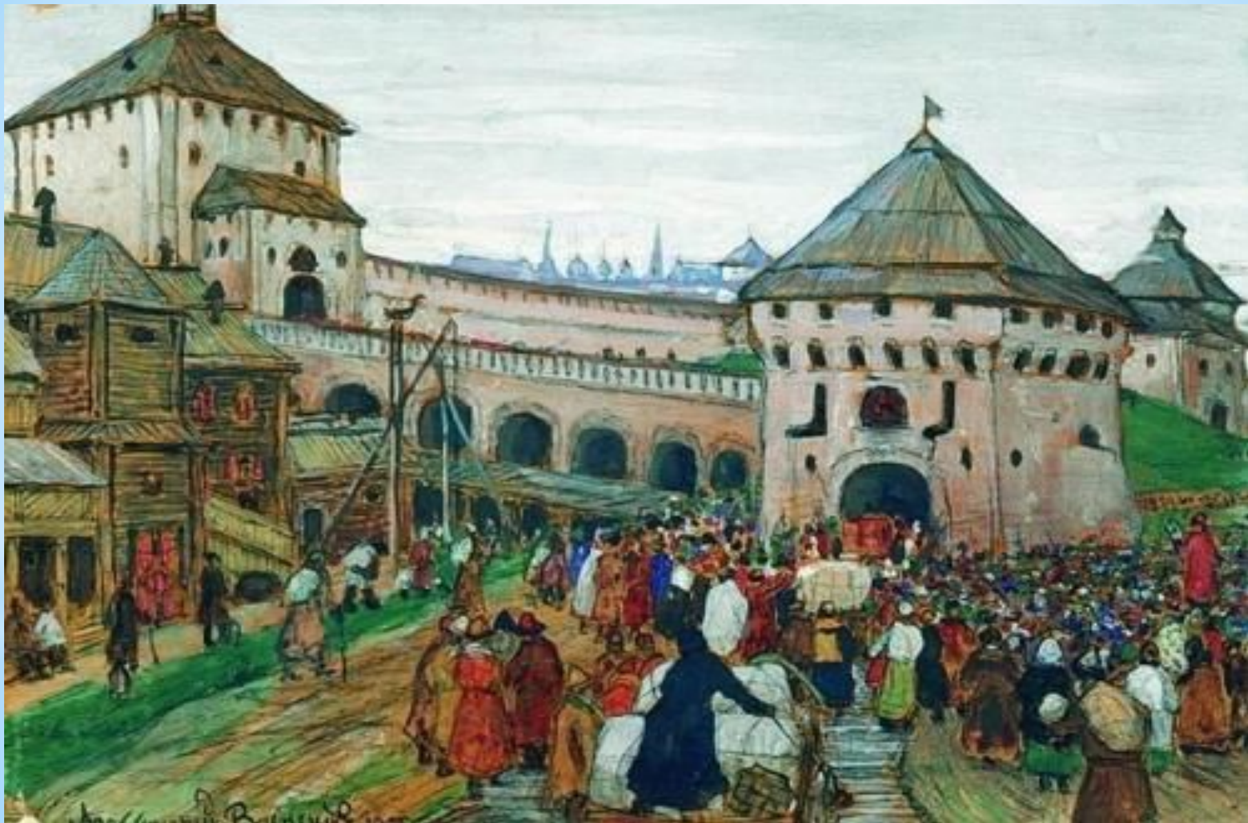
Васнецов А. Древний город Москва. XVI век.