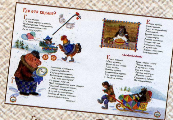
Где это вкдано?