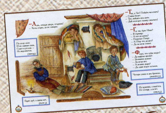
«Федул, что губы надул?..»