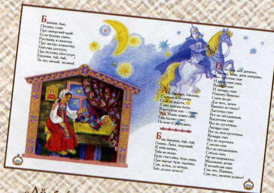
«Ай, баюшки, баюшки...»