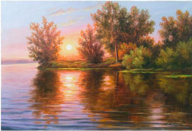
Рисунок 1 - Рассвет над Москвой -рекой