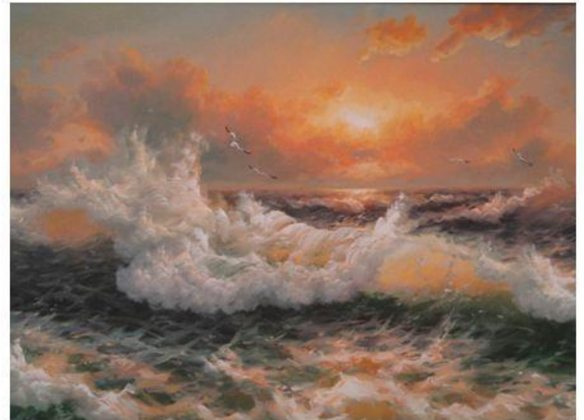
Рисунок 2 – Бушующее море