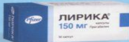
Капсулы 150 мг. Упаковка по 14 и 56 капсул.