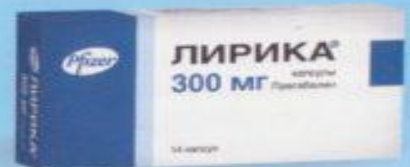
Капсулы 300 мг. Упаковка по 14 и 56 капсул.