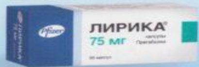
Капсулы 75 мг. Упаковка по 14 и 56 капсул.