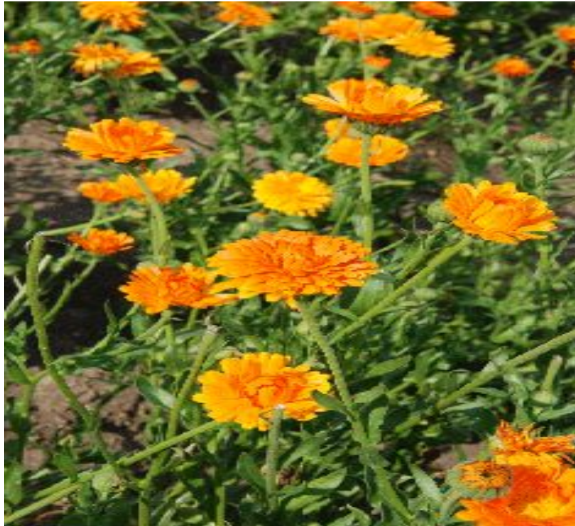
Календула ( Calendula officinalis , flores)