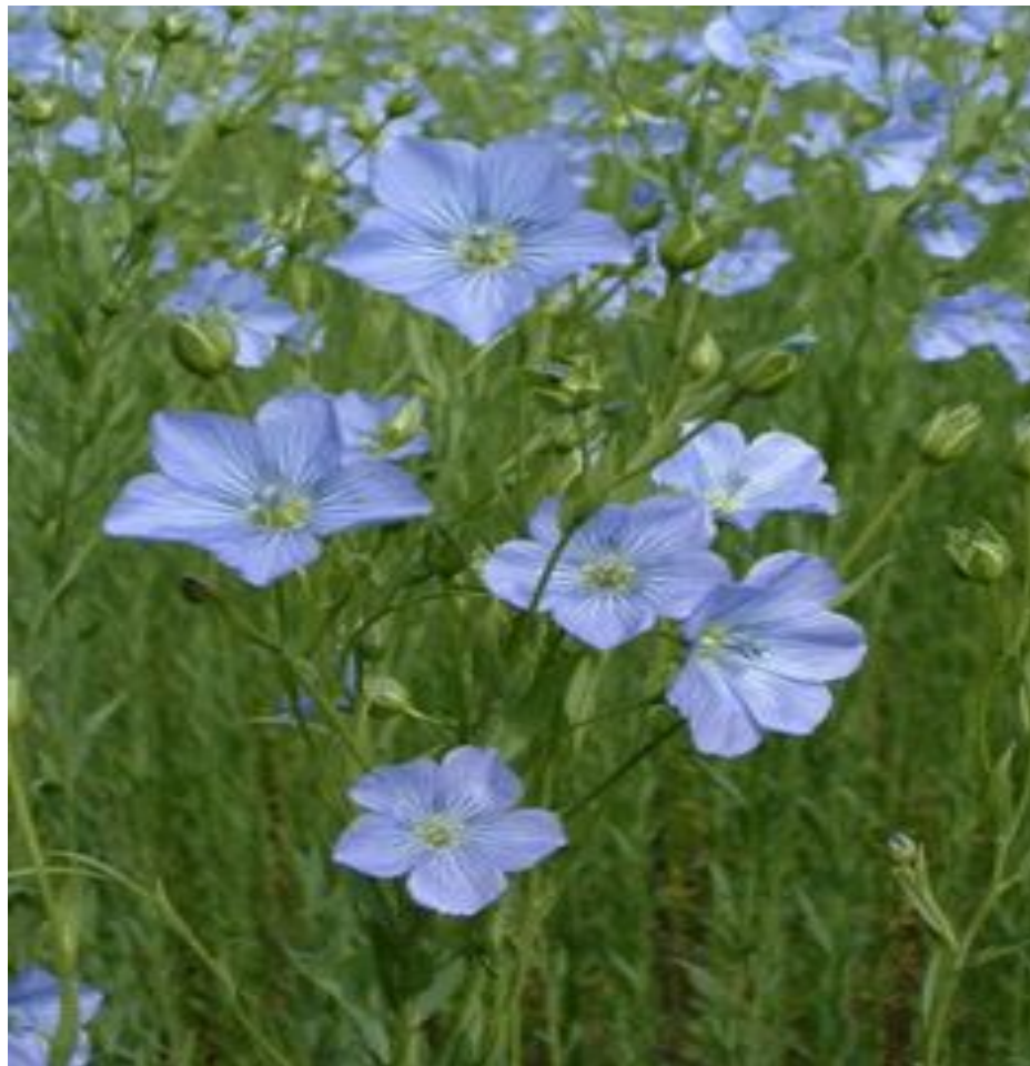
Лен посевной, семена ( Linum isitatissimum , semina)