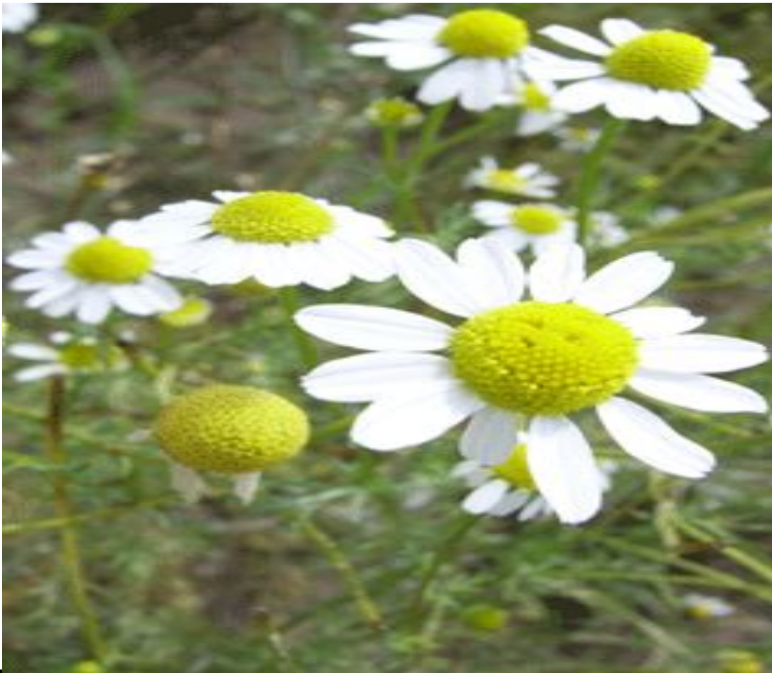
Ромашка аптечная, цветки ( Matricaria recutita , flores)