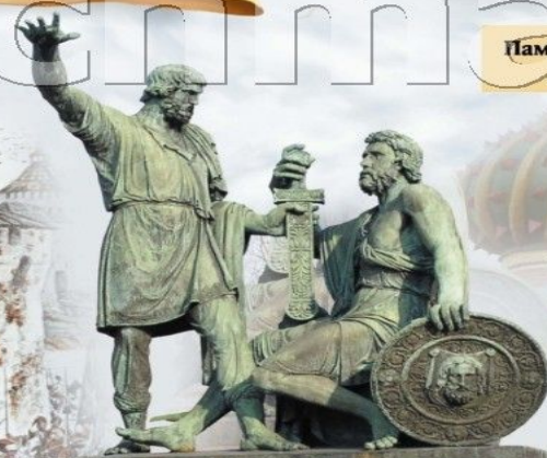
Памятник Минину и Пожарскому на Красной площади