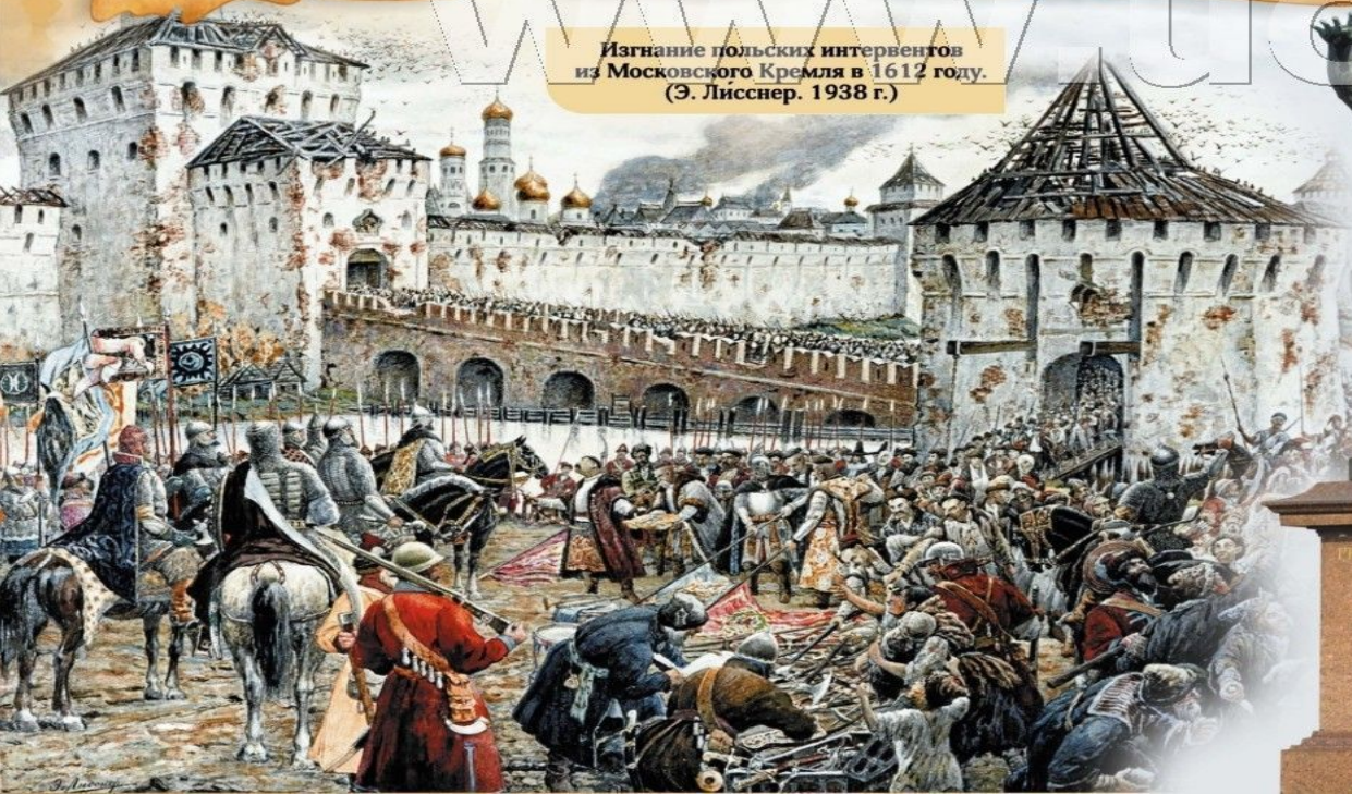
Изгнание польских интервентов из Московского Кремля в 1612 году. (Э. Лиснер. 1938 г.)