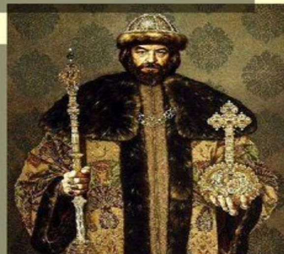
Федор Иванович Борис Годунов