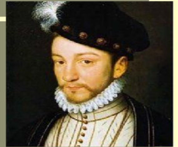
Василий Шуйский Карла IX