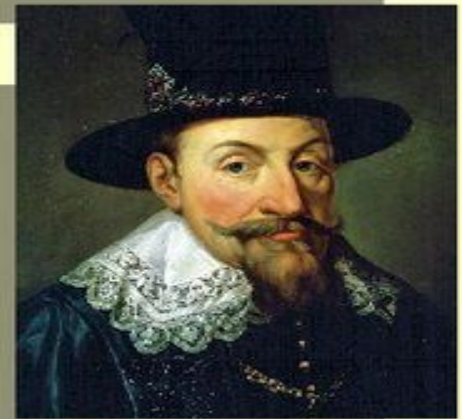
Лжедмитрий I (Григорий Отрепьев) Сигизмунд III Ваза