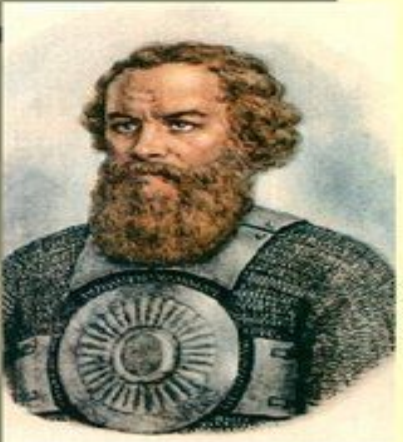
Князь Дмитрий Трубецкой Князь Дмитрий Михайлович Пожарский Кузьма Минин