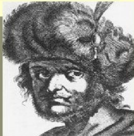
Иван Исаевич Болотников Лжедмитрий II (Тушинский вор)