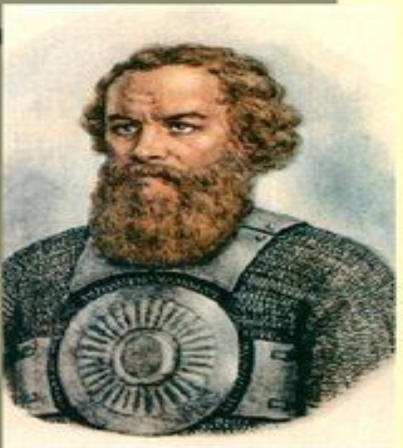
Князь Дмитрий Трубецкой Князь Дмитрий Михайлович Пожарский Кузьма Минин