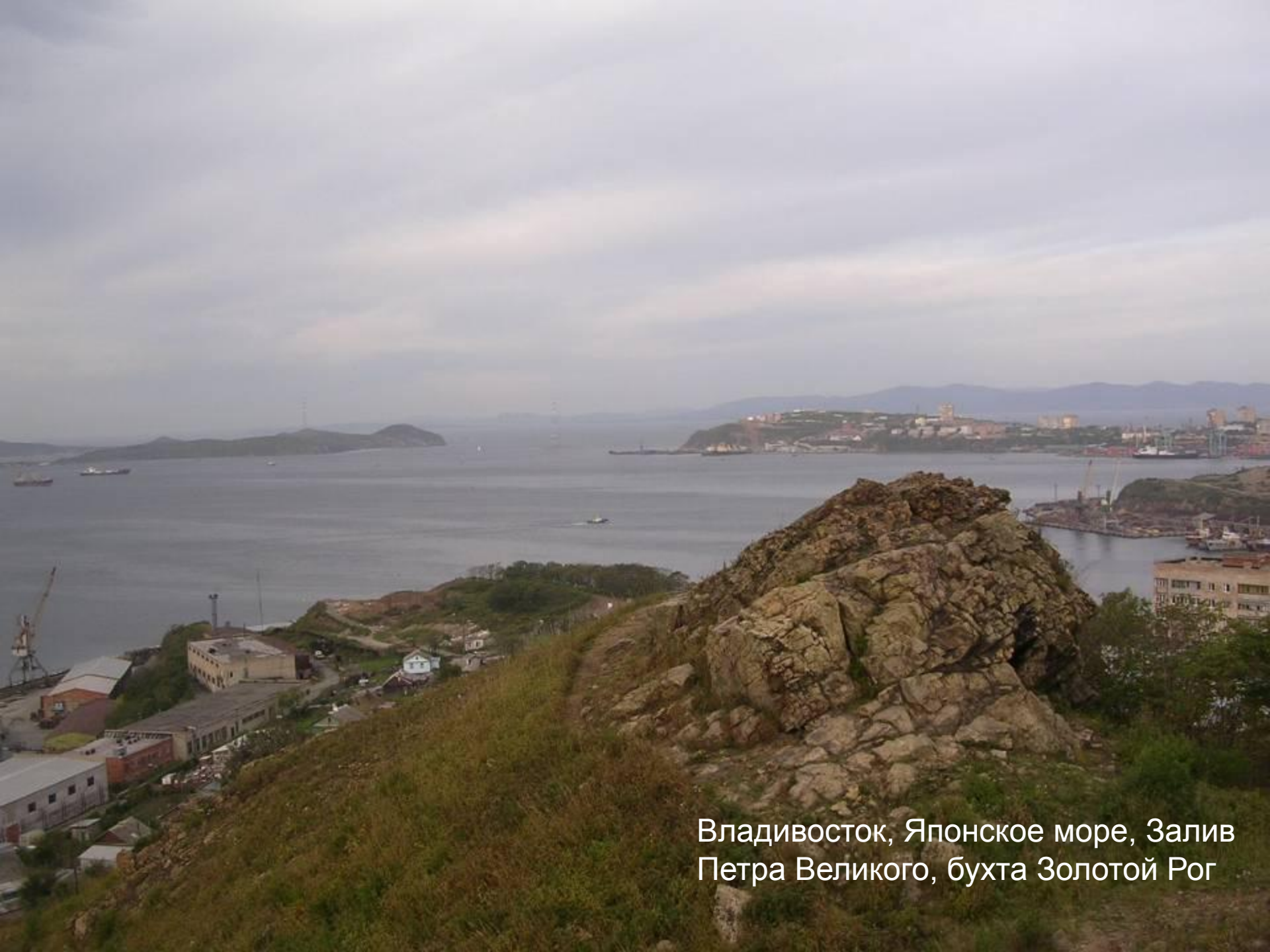
Владивосток, Японское море, Залив Петра Великого, бухта Золотой Рог