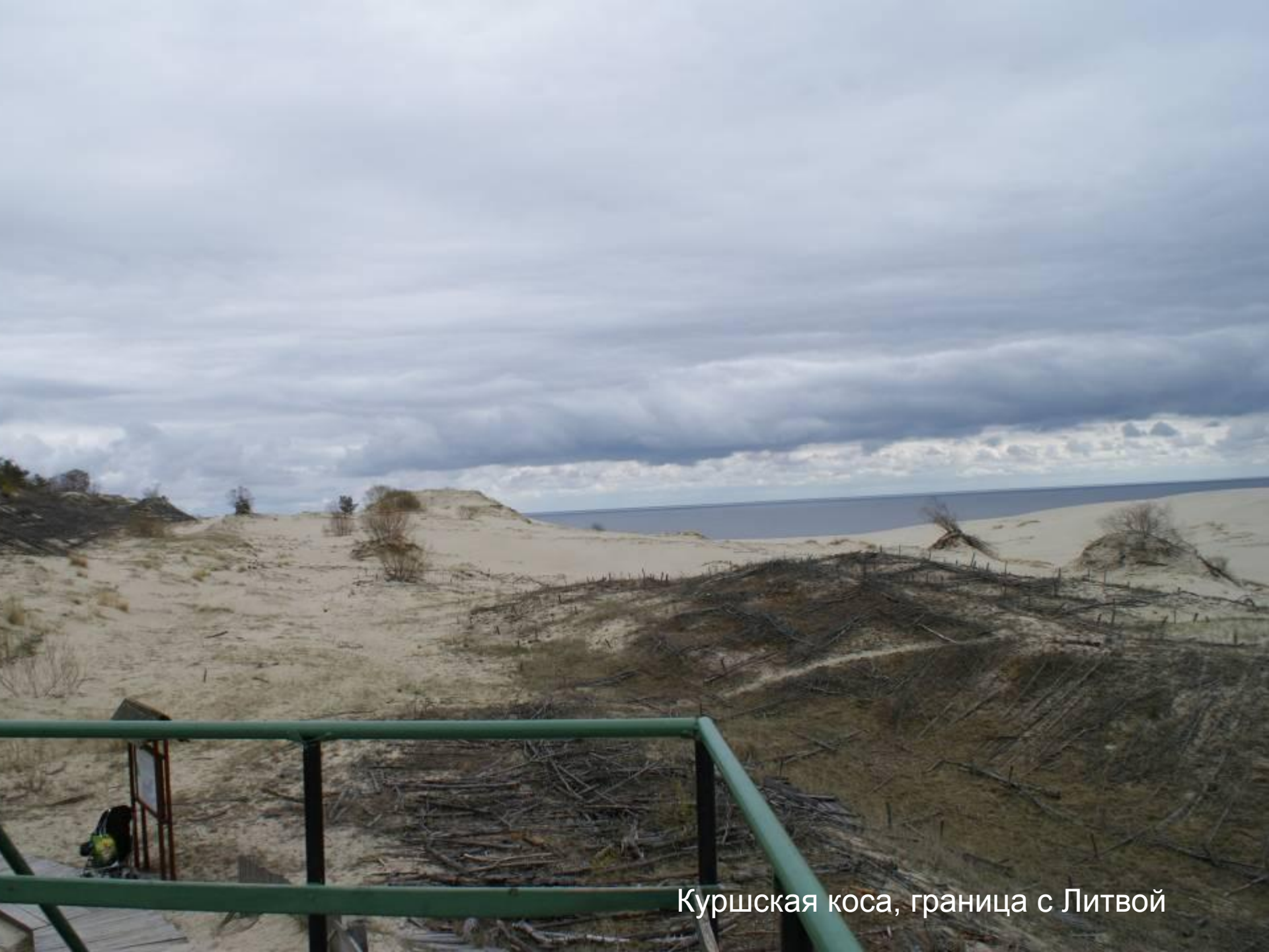
Куршская коса, граница с Литвой