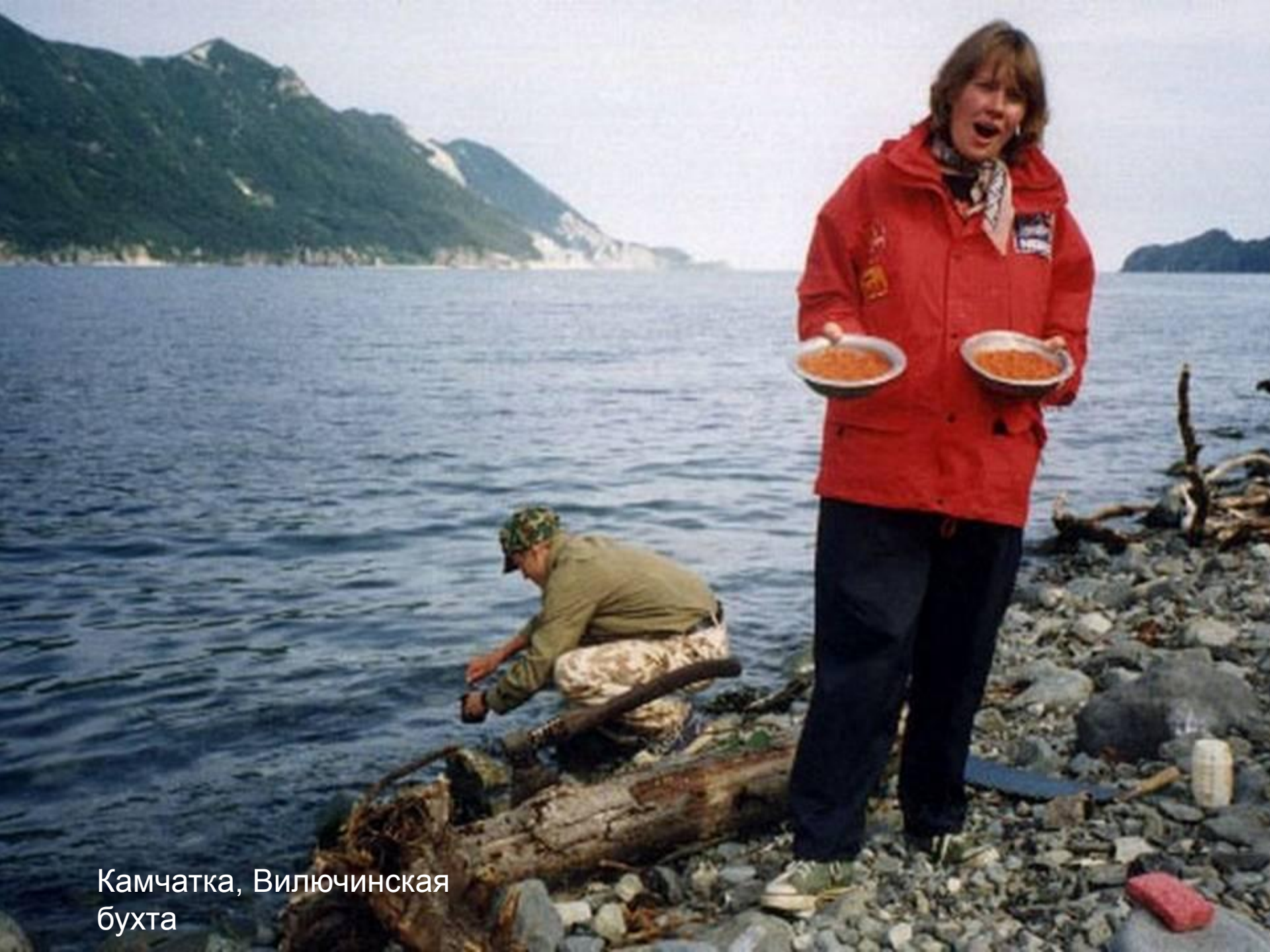
Камчатка, Вилючинская бухта