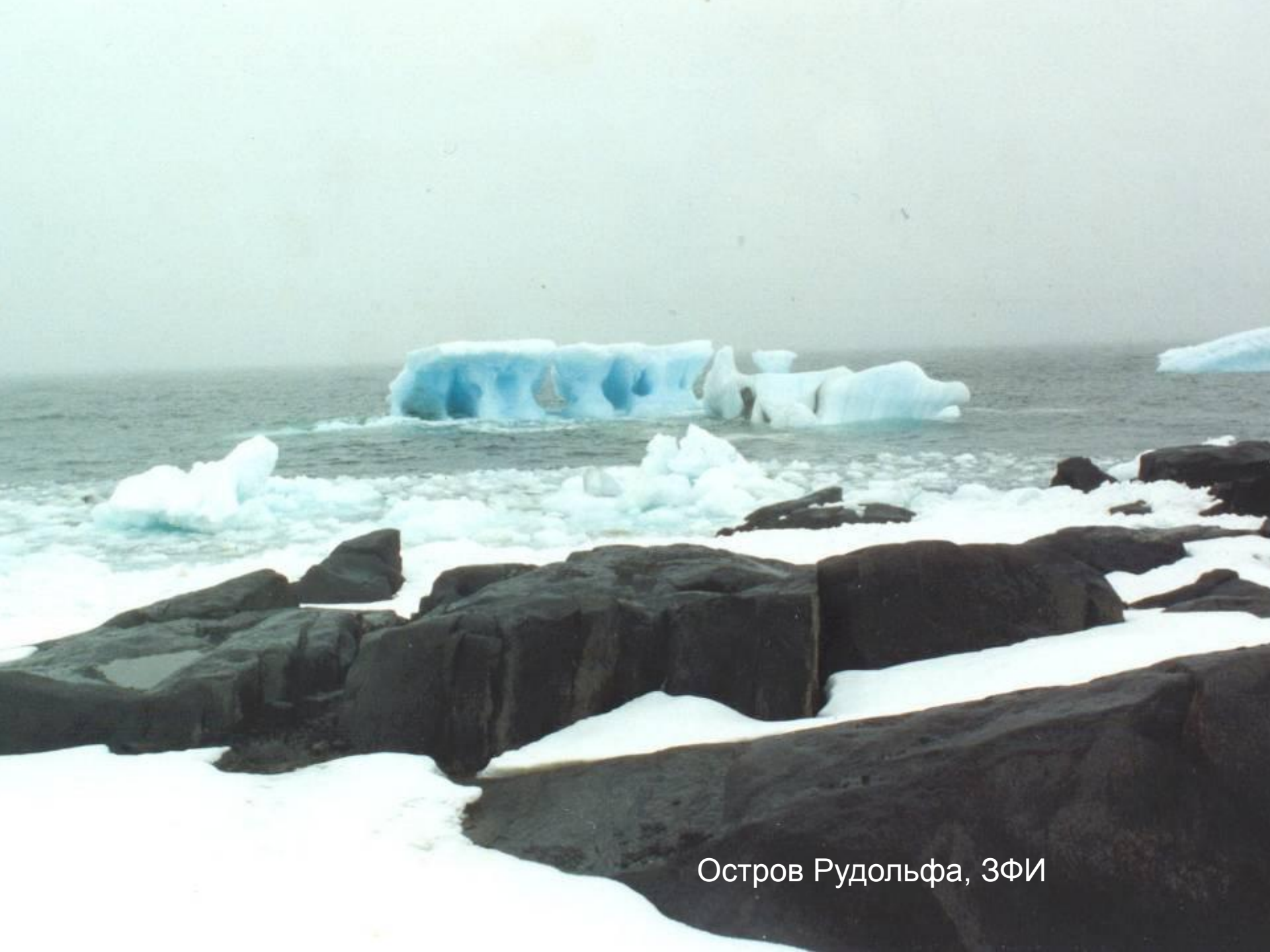
Остров Рудольфа, ЗФИ