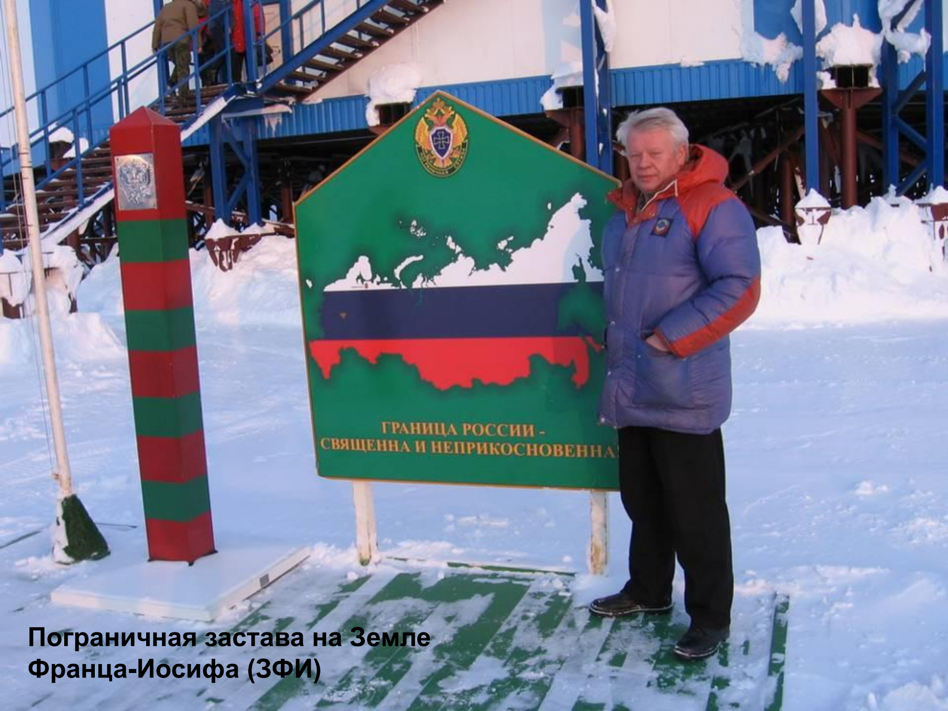
Пограничная застава на Земле Франца-Иосифа (ЗФИ)