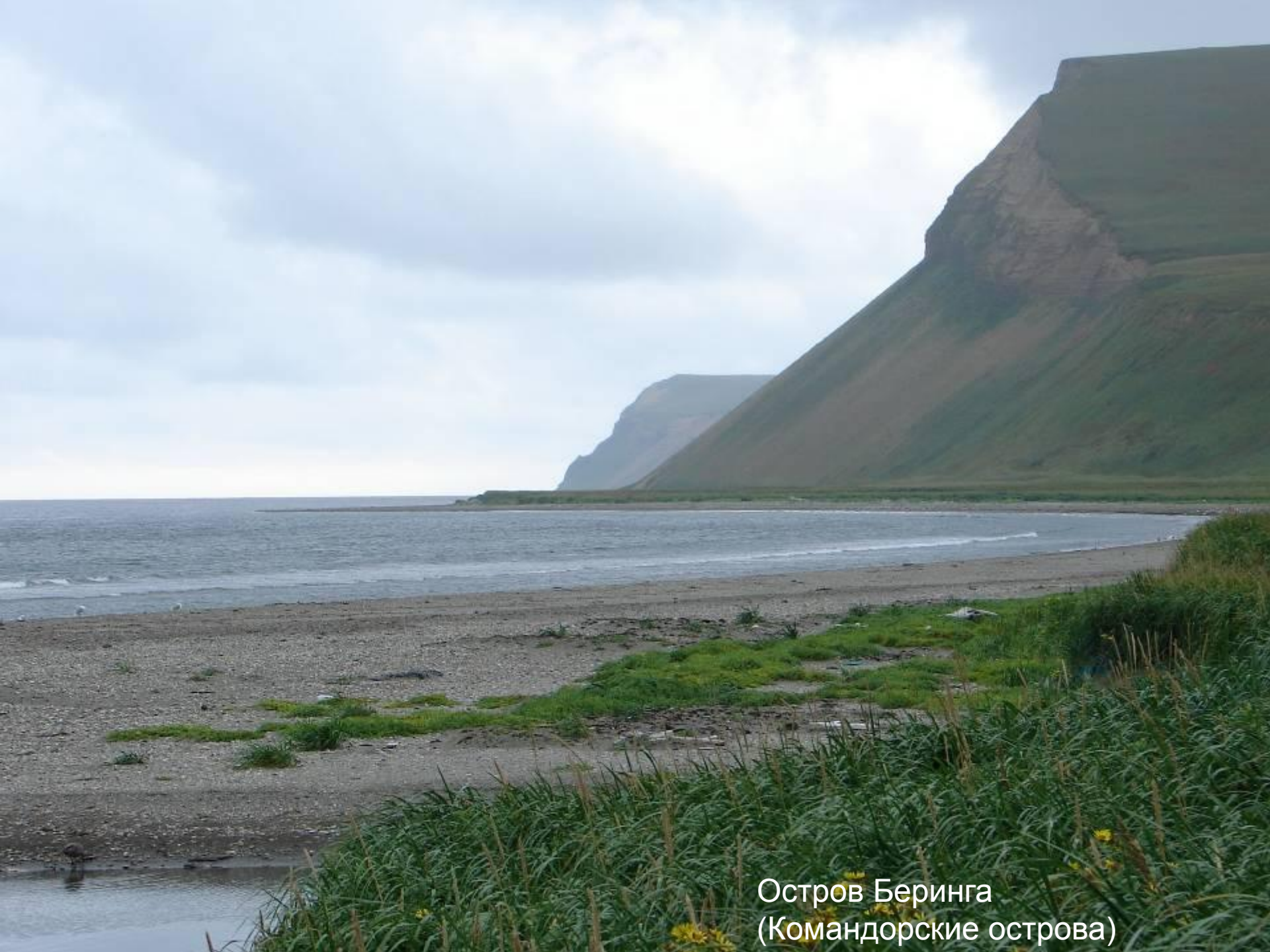
Остров Беринга (Командорские острова)