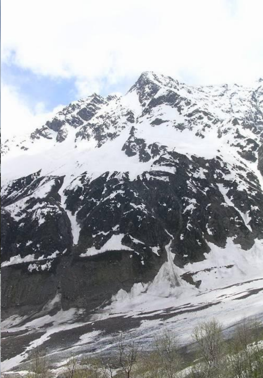
Большой Кавказский хребет (граница с Грузией)