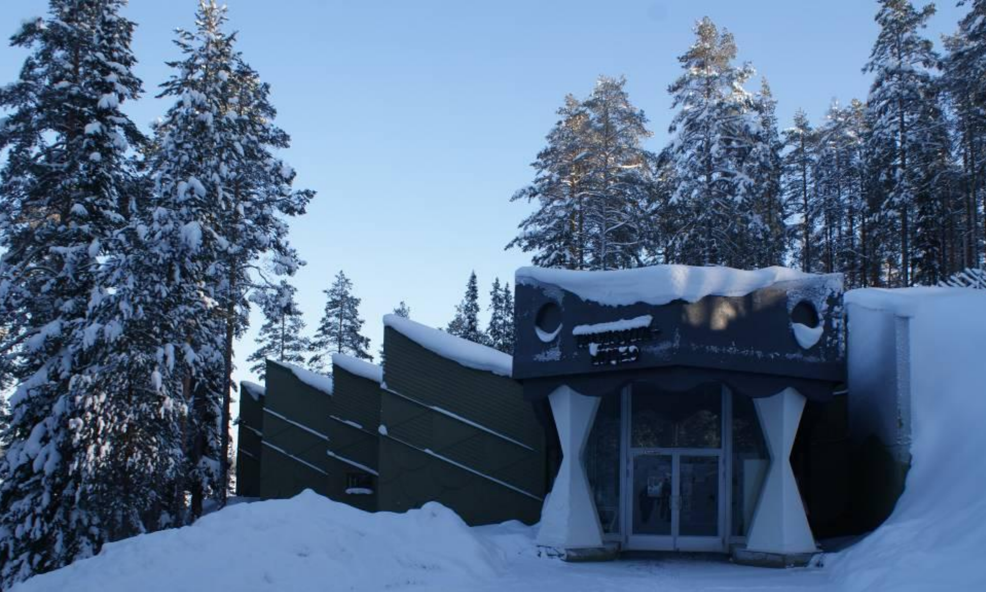
Мемориал, посвященный Финской («Зимней») войне, неподалеку от границы с Россией