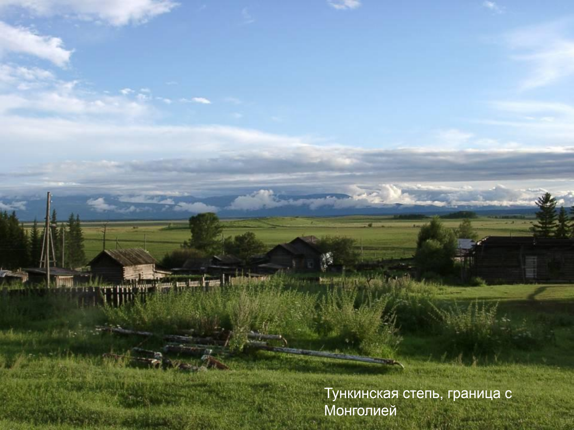
Тункинская степь, граница с Монголией