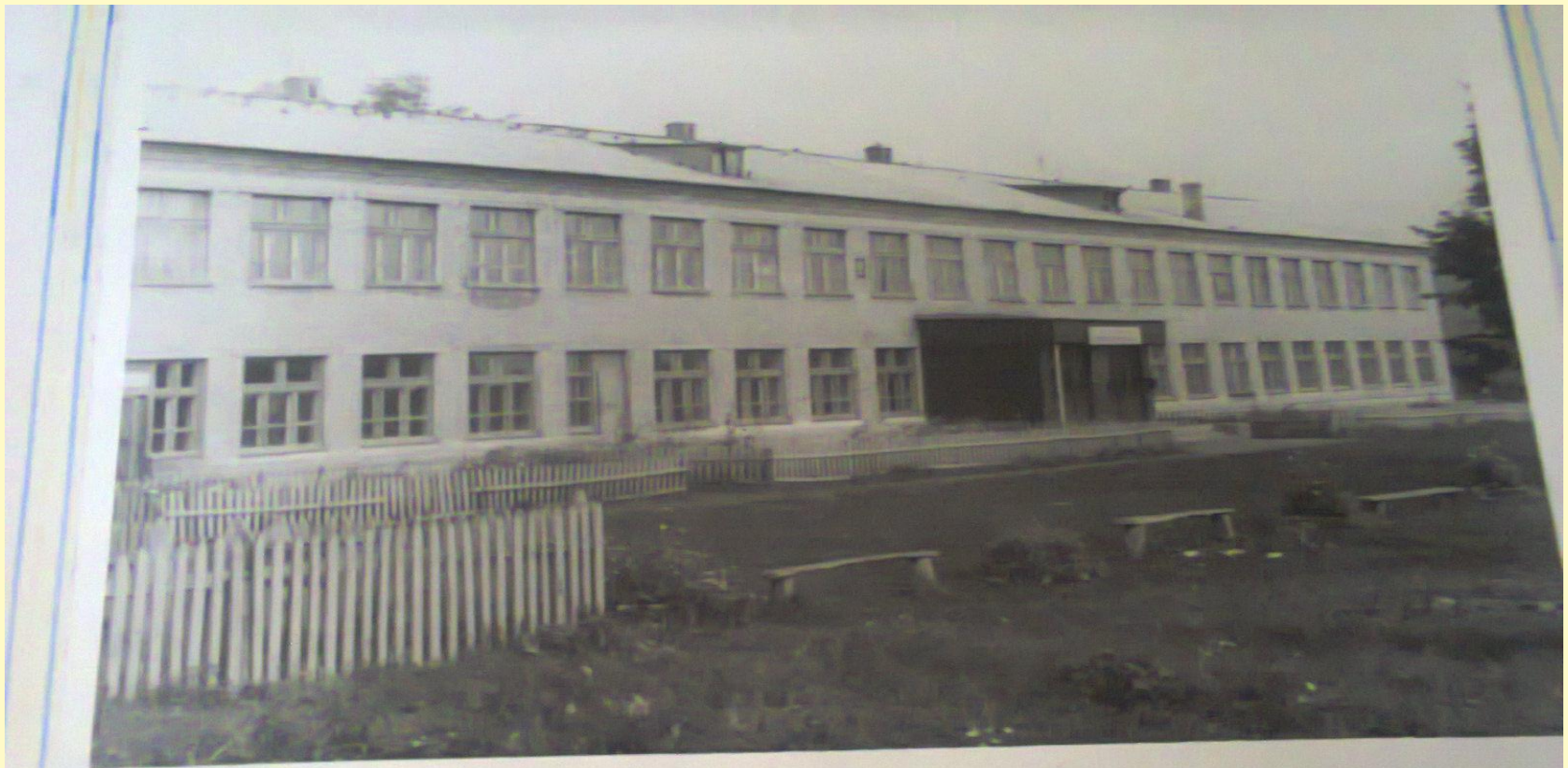
Здание Тимонинской средней школы.