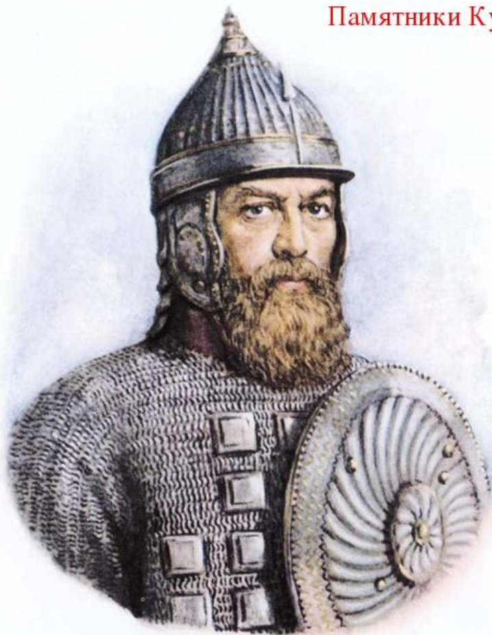
Памятники Кузьме Минину и Дмитрию Пожарскому