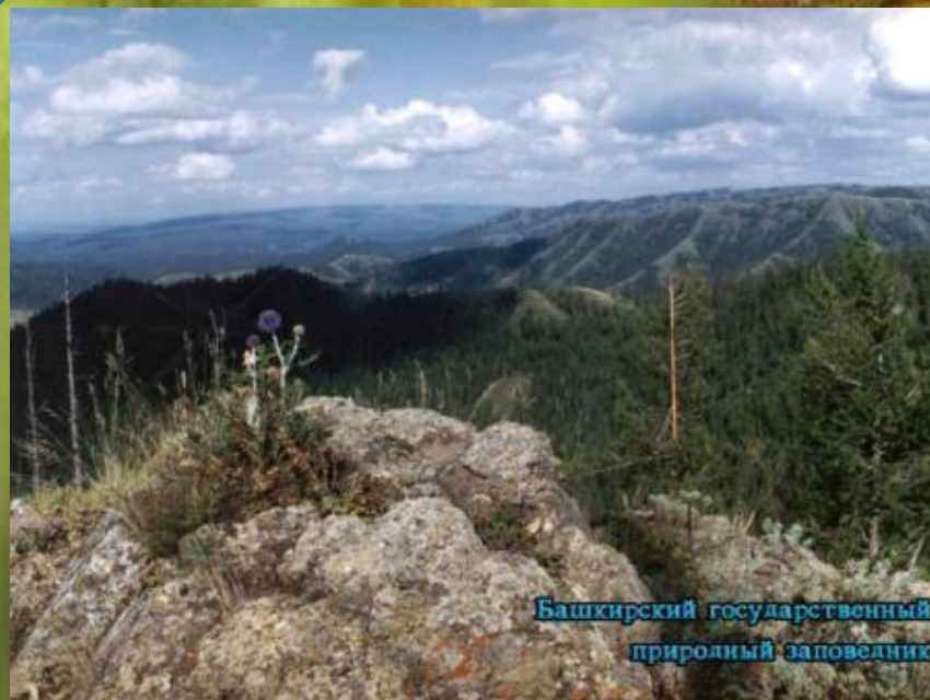
Башкирский государственный природный заповедник