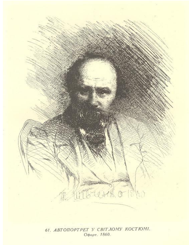
61. АВТОПОРТРЕТ У СВІТЛОМУ КОСТЮМІ. Офорт. 1860.