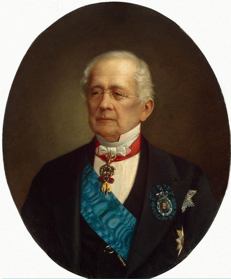
Горчаков Алексей Михайлович

Сформулировал внешнеполитическую программу: