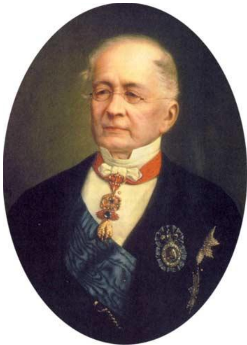
Горчаков Алексей Михайлович

Вывести Россию из международной изоляции