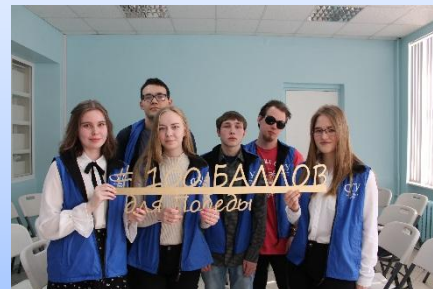
Акция «100 баллов для победы»