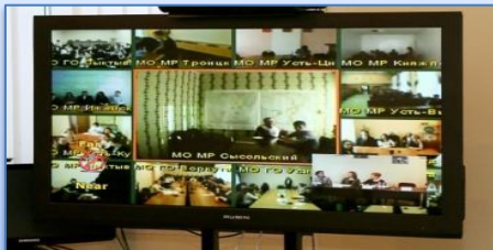
Республиканские собрания с родителями и выпускниками