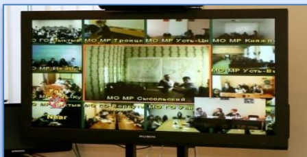
Республиканские собрания с родителями и выпускниками