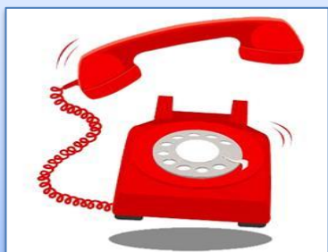
Работа «горячей линии» по вопросам ГИА