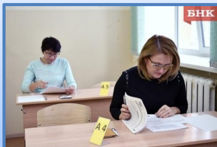
Акция «Экзамены для всех»