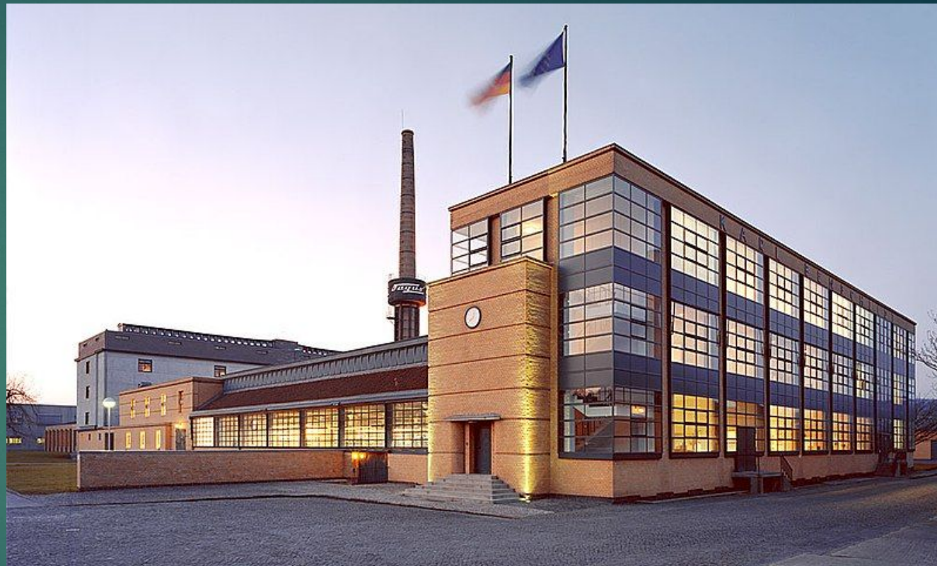
Вальтер Гропиус - немецкий архитектор, один из основателей и директор Баухауса