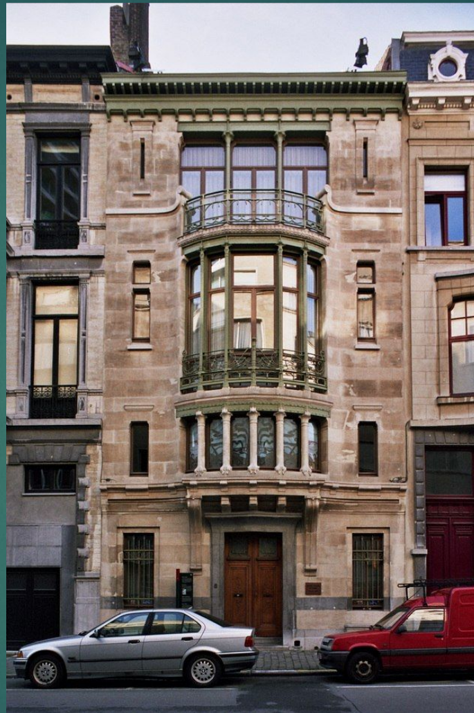
Особняк Тасселя, Брюссель, 1893-1894 гг.

Архитектурный модернизм— движение в архитектуре двадцатого века, переломное по содержанию, связанное с решительным обновлением форм и конструкций, отказом от художественных стилей прошлого. Модернизм включает такие архитектурные течения первой половины XX века, как европейский конструктивизм, функционализм и рационализм в 1920-х годах СССР, движение «Баухаус» в Германии, интернациональный стиль 1930-1950-х годов в Германии и США, брутализм, советский модернизм, органическая архитектура.