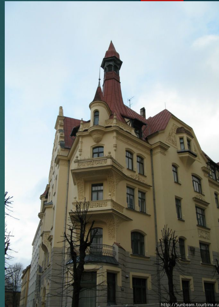
Музей югендстиля, Рига, 1903 г.