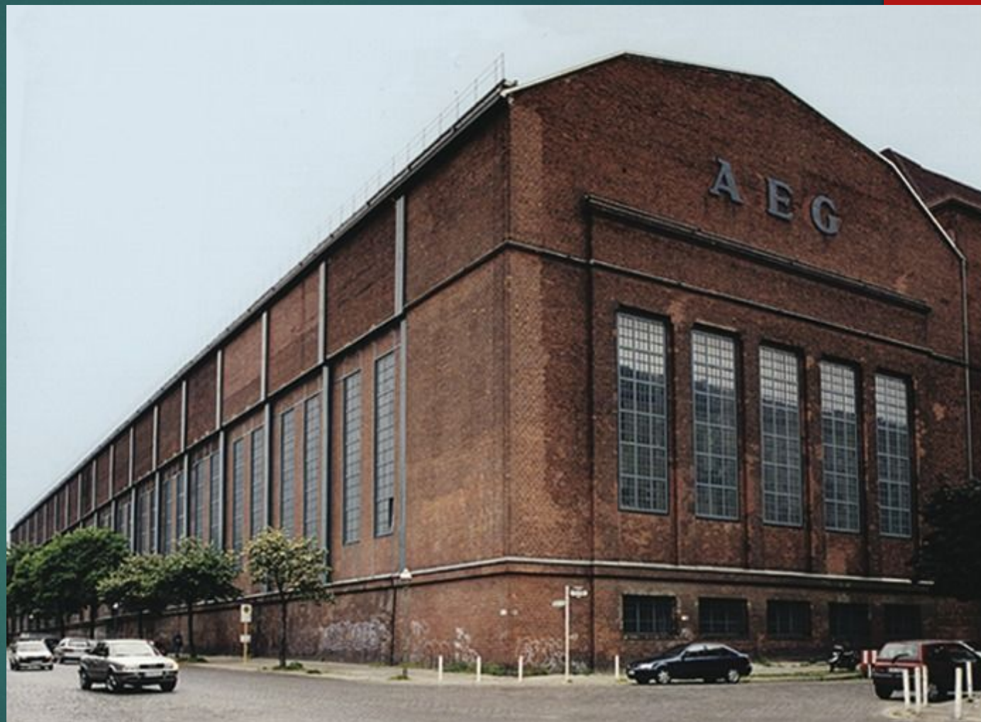
Турбинный завод в германии 1909

В промышленности особенно преуспевала Германия, на тот момент лидер экономического прогресса в Европе. Крупный промышленный концерн AEG (Всеобщее Электрическое Общество) пригласил известного архитектора Петера Беренса на пост главного архитектора и проектировщика AEG. Его фабричные комплексы AEG в Берлине, и особенно турбинный завод, построенный им для концерна в 1909 г. — массивные, строгие, подчеркнуто монументальные здания — стали своего рода символом промышленной мощи и силы капитала.