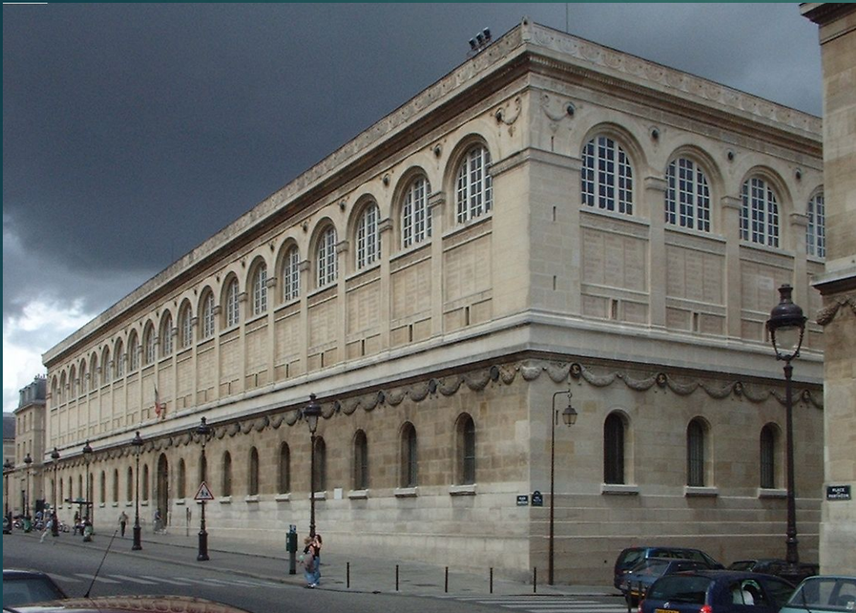
Библиотека Сен-Женевьев в Париже (1850)

Известные постройки этой эпохи, возведённые с применением металлических конструкций: