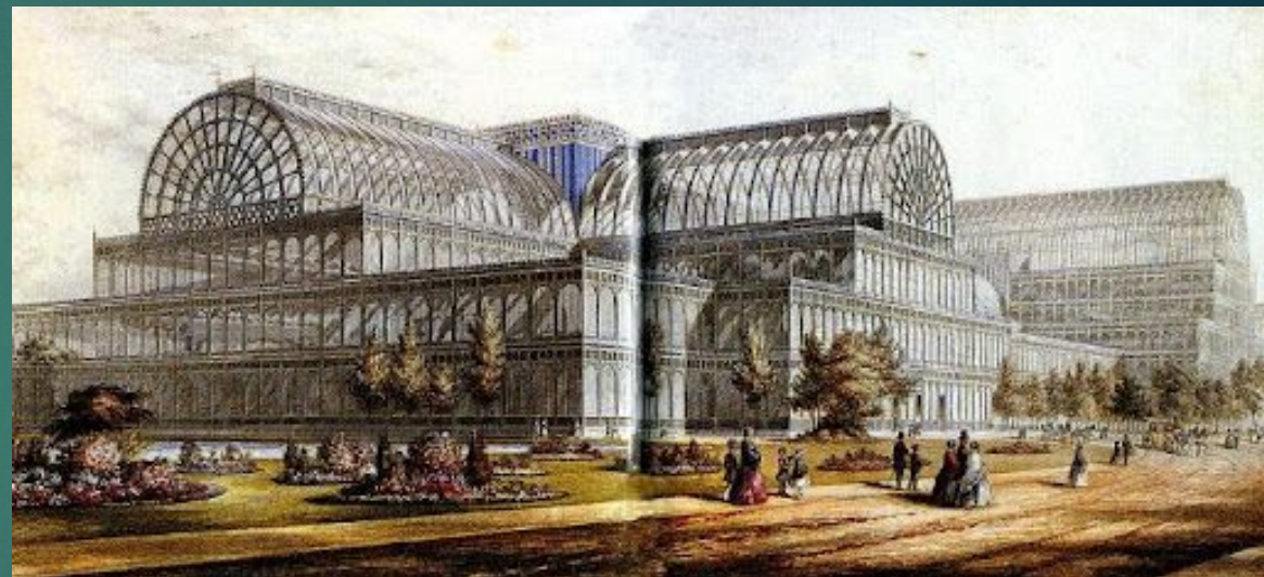
Хрустальный дворец Д. Пэкстона в Лондоне (1851)