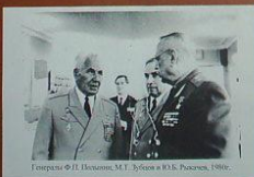
Генералы Ф.П. Полынин, М.Т. Зуев и Ю.А. Рыжков. 1980г.