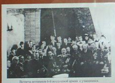
Встреча ветеранов 6-ой воздушной армии с учениками