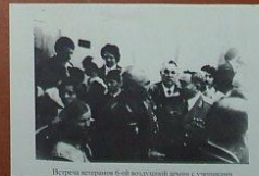
Встреча ветеранов 6-ой воздушной армии с учениками