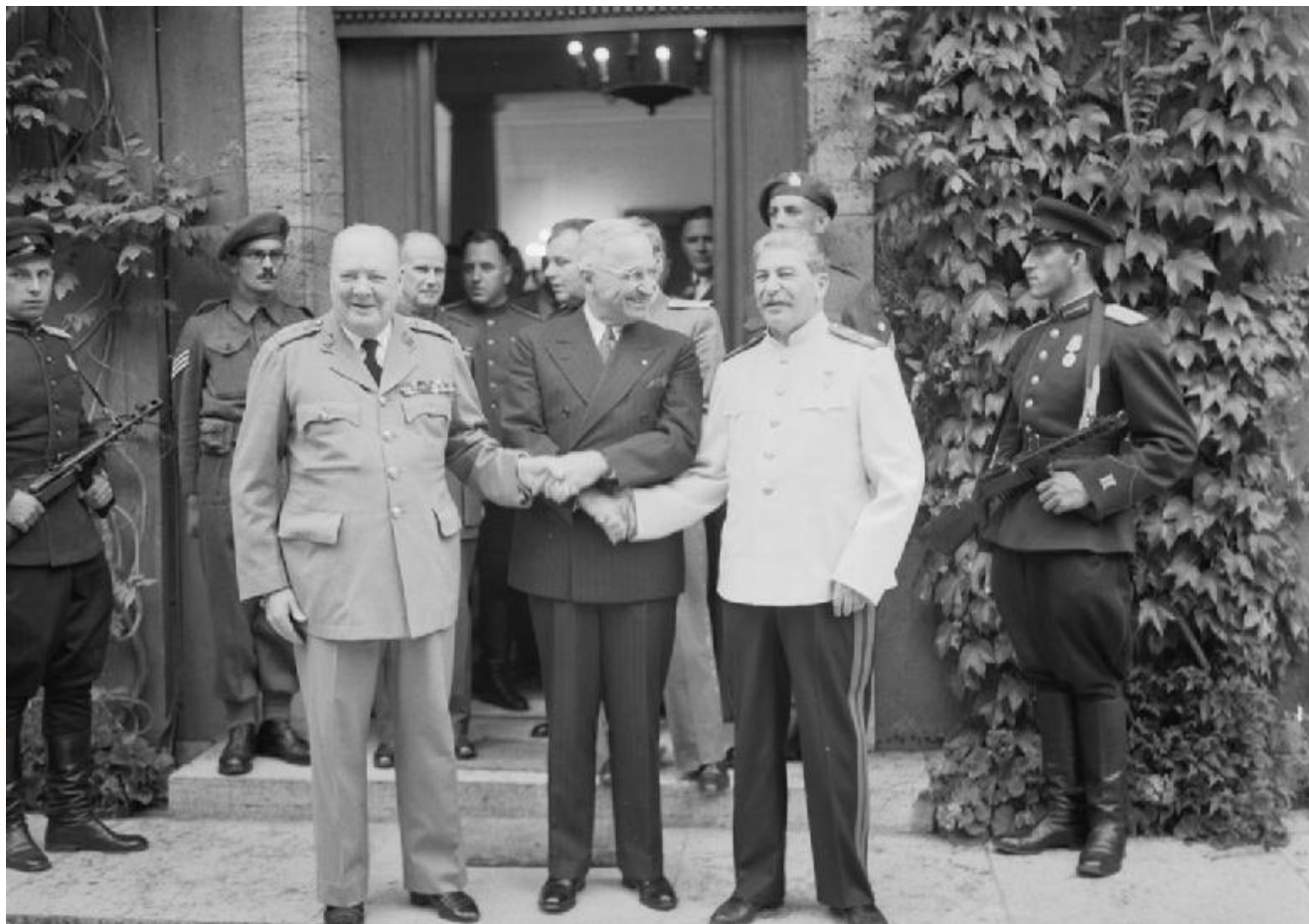
У. Черчилль, Г. Трумэн, И. В. Сталин. Потсдам, 23 июля 1945 года

Из всей коалиции государств, развязавших Вторую мировую войну, после мая 1945 г. продолжала борьбу только Япония.