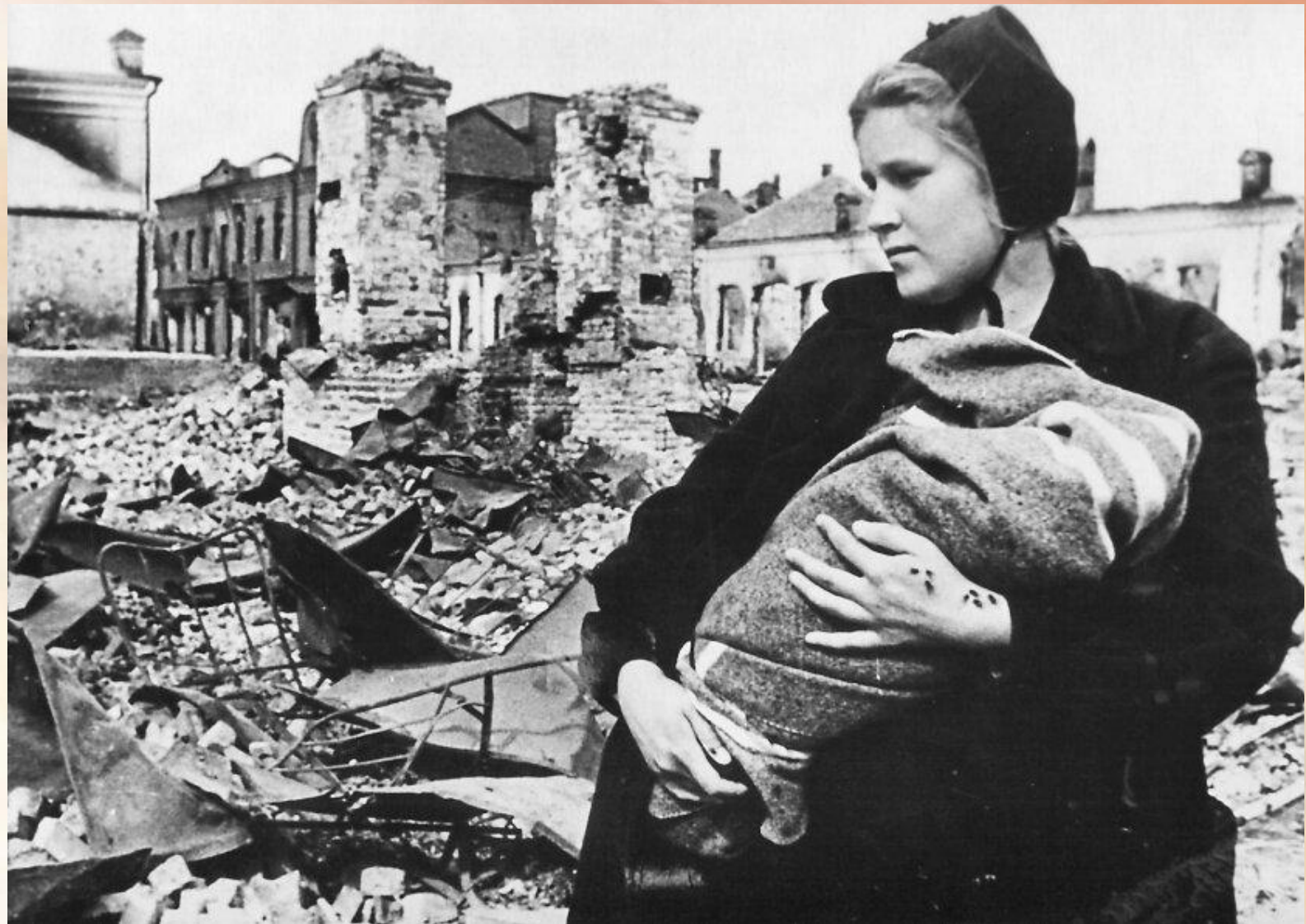
Дома у него осталась семья: родители, жена и ребенок