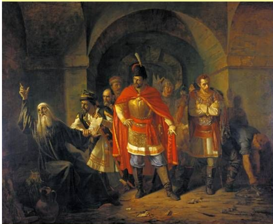
Патриарх Гермоген отказывает полякам подписать грамоту. Худ. П. Чистяков

Патриарх Гермоген отказался признать Владислава царем и запретил москвичам присягать ему.