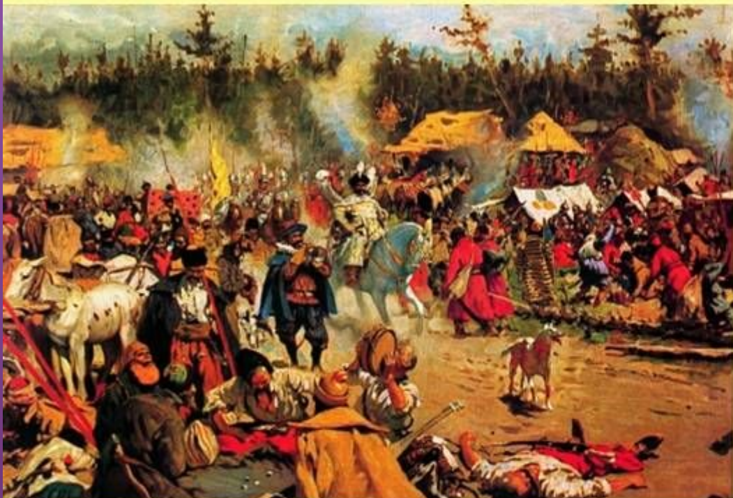
Смутное время. Худ. С. Иванов

Бесчинства и грабежи тушинцев оттолкнули от них поддержавшее их поначалу население