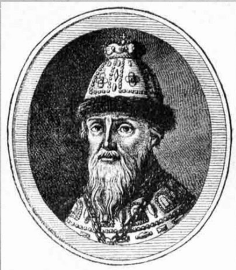
Князь Федор Иванович Мстиславский

1610 – 1612 годы междуцарствия, правило правительство из 7 бояр - семибоярщина