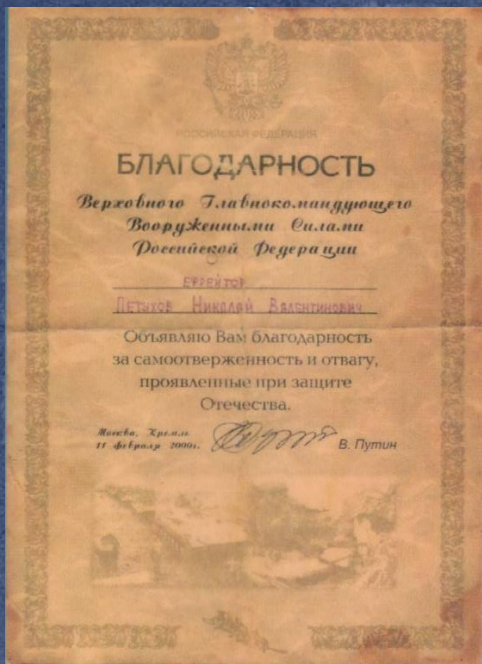
Фото и материал предоставлены Николаем Валентиновичем Петуховым.

Благодарственное письмо от Красноуфимской местной организации Общероссийской общественной организации инвалидов войны в Афганистане и военной травмы «Инвалиды войны» за активное участие в рамках военно – патриотического воспитания молодежи и общественных делах организации КМО ОООВВА «Инвалиды войны».