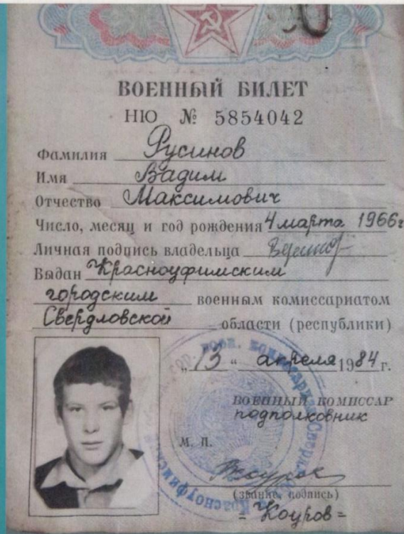
Фото и материал предоставлены Вадимом Максимовичем Русиновым.

В настоящее время проживает в д. Большое Кошаево.