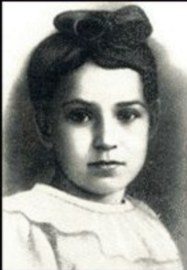
Савичева Татьяна Николаевна (23.01.1930 - 01.06.1944)