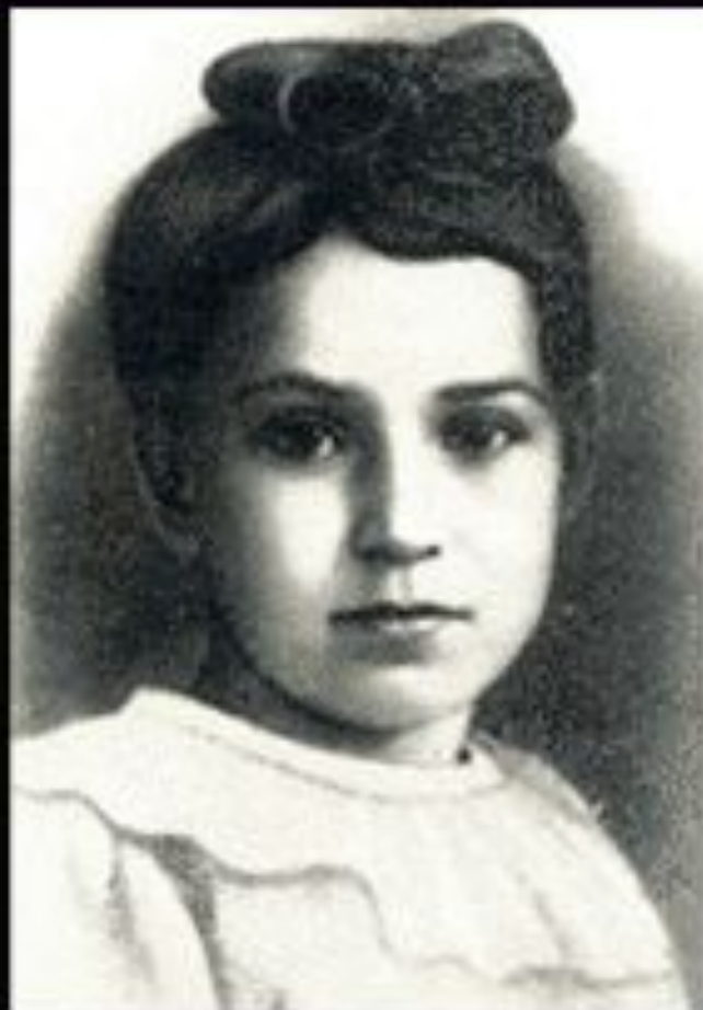
Савичева Татьяна Николаевна (23.01.1930 - 01.06.1944)