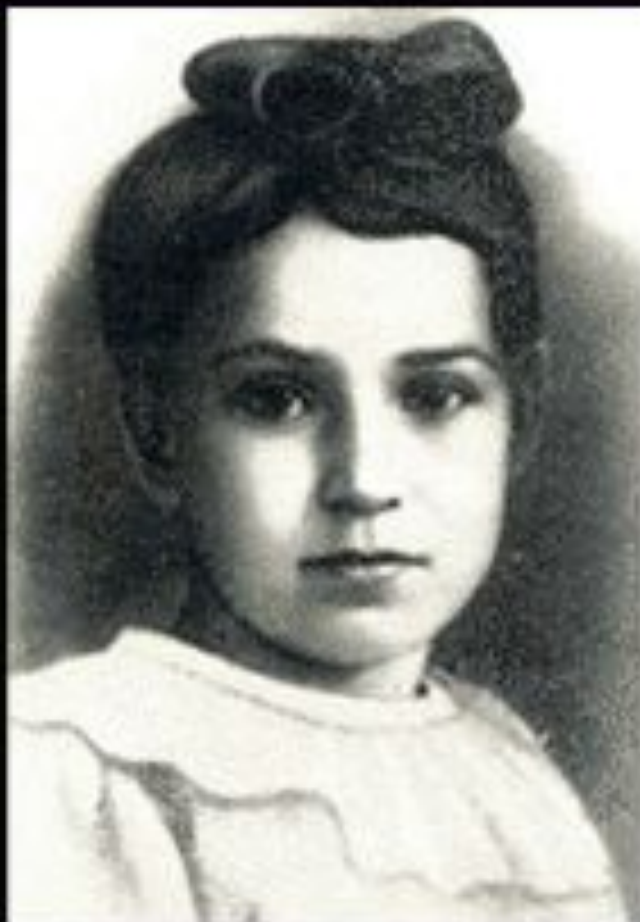
Савичева Татьяна Николаевна (23.01.1930 - 01.06.1944)