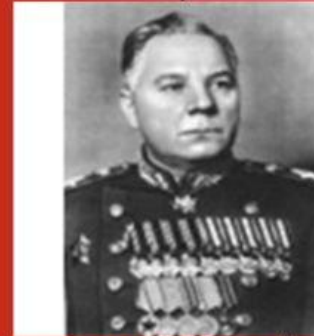
С. М Будённый