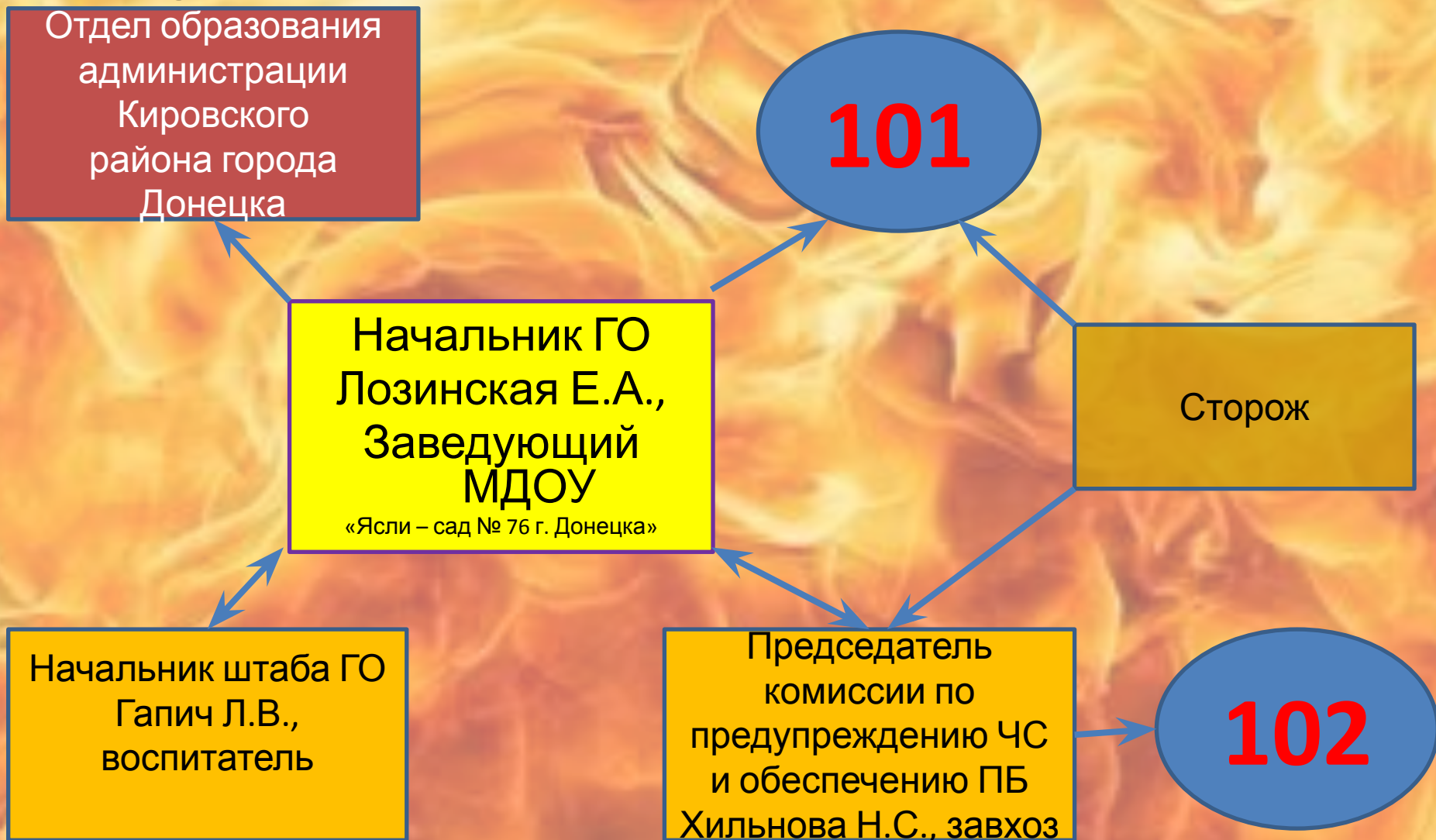
Схема оповещения и связи при угрозе и возникновении ЧС