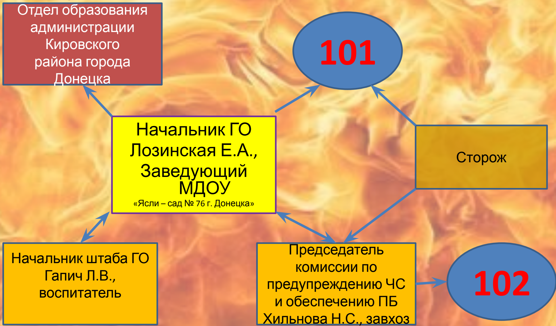
Схема оповещения и связи при угрозе и возникновении ЧС