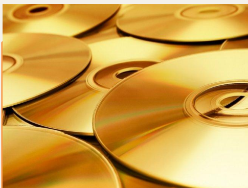
CD-R, CD-RW, DVD-R, DVD-RW диски