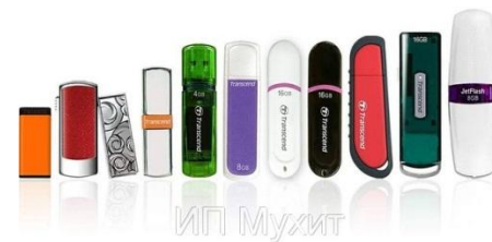
FLASH - накопители