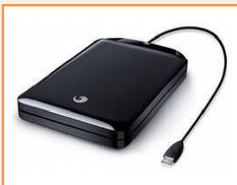
внешний жесткий диск