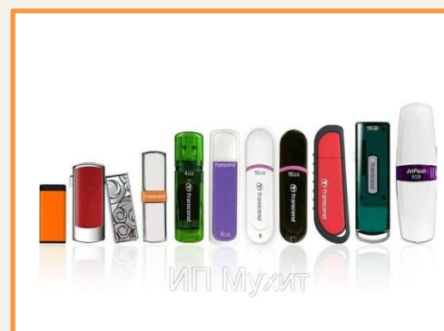
FLASH - накопители