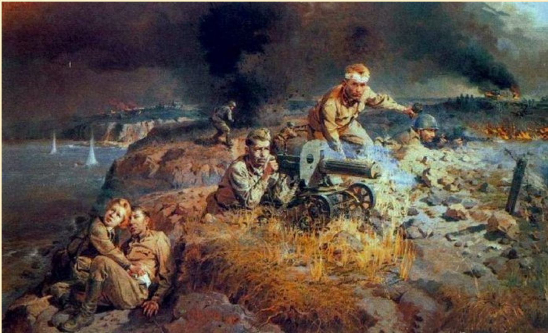
«Солдаты Сталинграда», Борис Махов