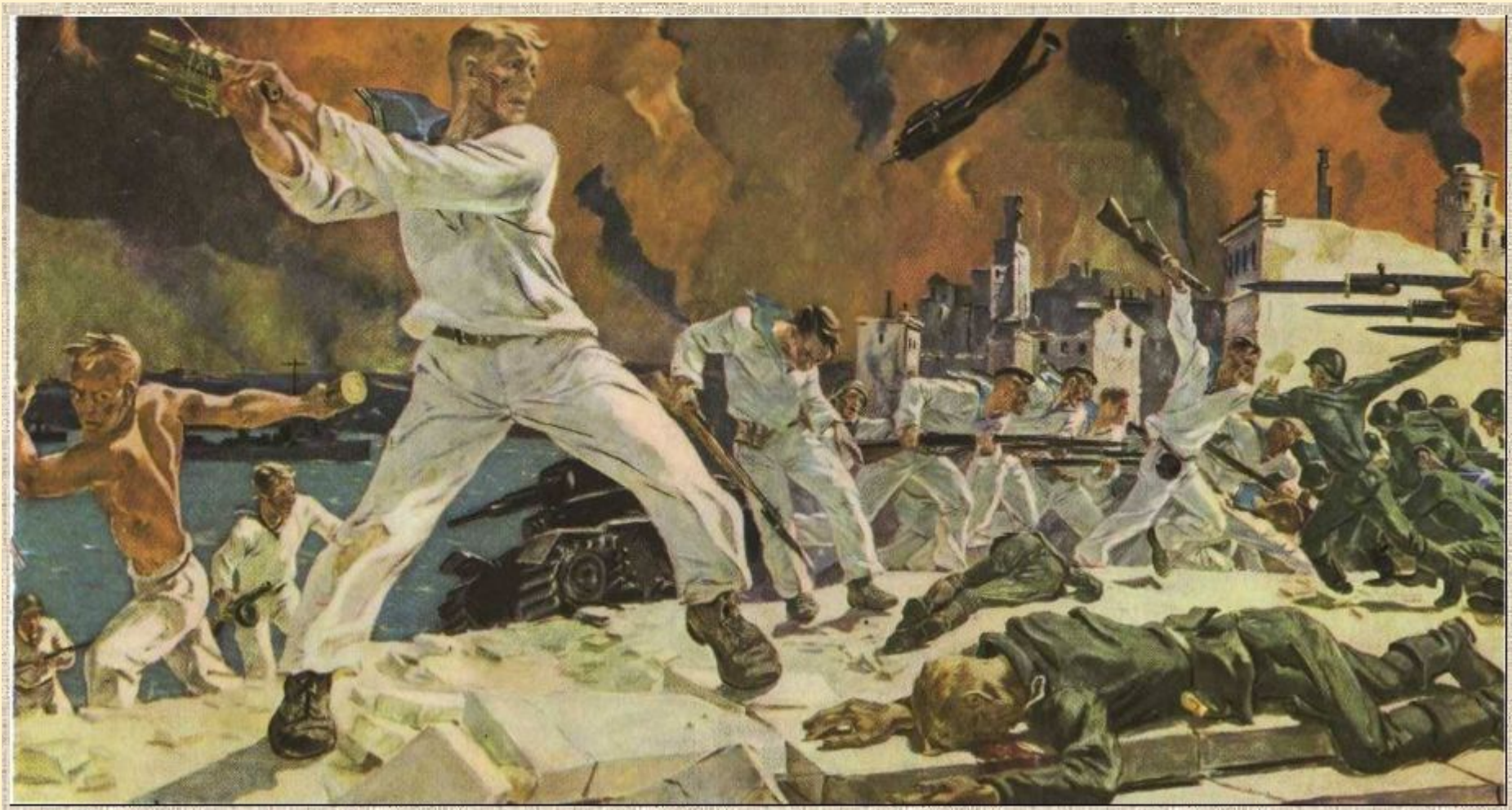
Битва за Севастополь Художник А. Дайнеко