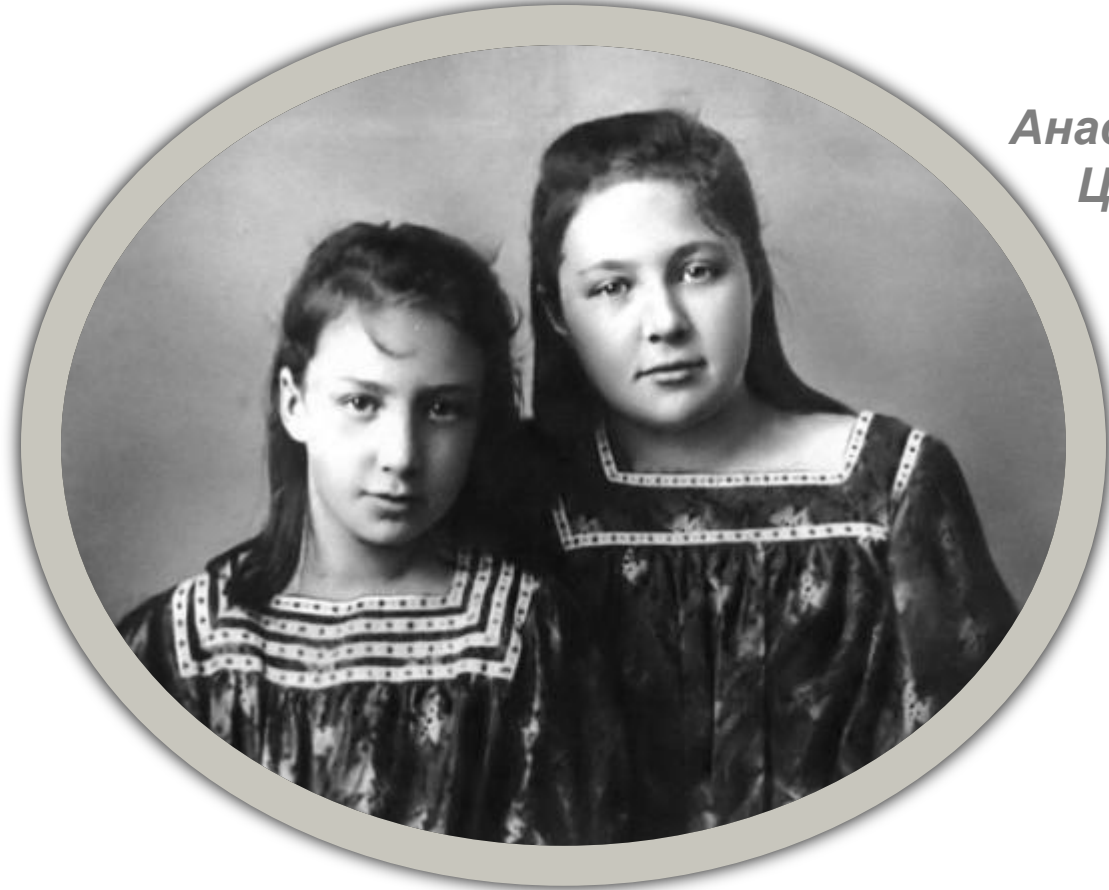
Анастасия (слева) и Марина Цветаевы. Ялта, 1905.

После смерти матери от чахотки в 1906 году Марина с сестрой Анастасией остались на попечении отца.