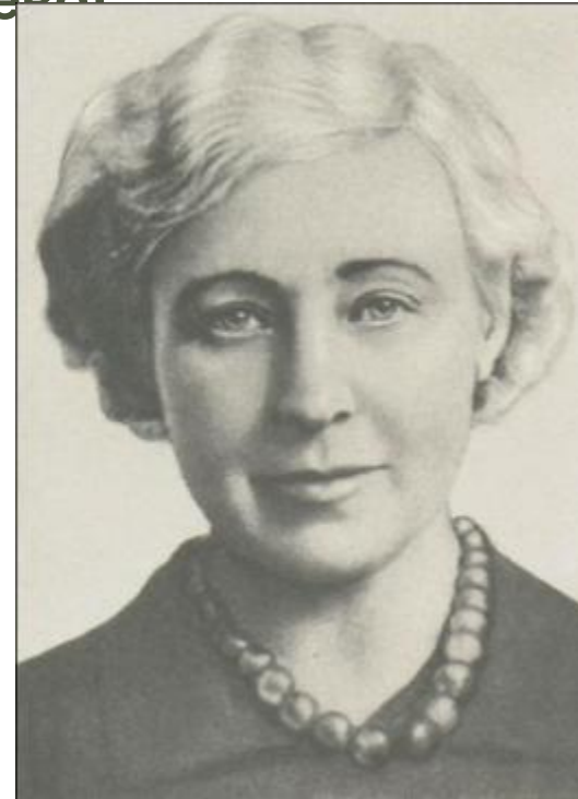
М.И. Цветаева, Франция, 1939 г. Фото на паспорт перед возвращением на Родину