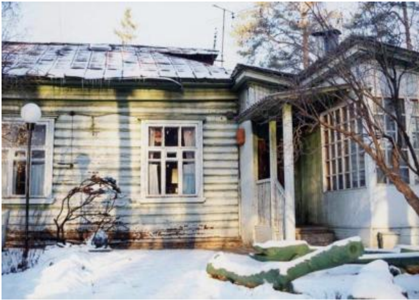
Дом-музей Цветаевой в Болшево, город Королёв

В 1939 году Цветаева вернулась в СССР вслед за мужем и дочерью. По приезду жила на даче НКВД в Болшево (ныне Музей-квартира М. И. Цветаевой в Болшево)