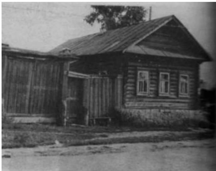
Дом, где покончила с собой М.И. Цветаева

31 августа 1941 года Марина Цветаева покончила жизнь самоубийством, повесилась в доме, куда вместе с сыном была определена на постой. Она оставила три предсмертные записки: тем, кто будет её хоронить («эвакуированным», Асеевым и сыну).