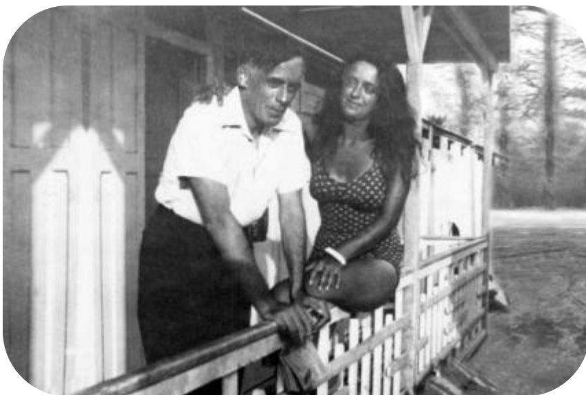
Сергей Эфрон с дочерью Ариадной (Алей),