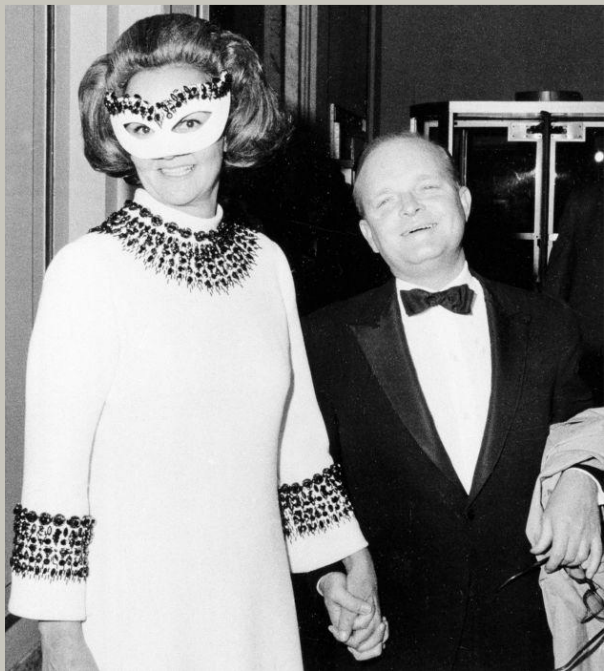
(Трумен Капоте и Катерина Грэхем )

Вечер, к которому Капоте готовился целый год, он посвятил Катерине Грэхем — самой влиятельной женщине Америки тех лет. Она дружила с Джоном и Джеки Кеннеди, Рональдом и Нэнси Рейган, Линдоном Джонсоном и Робертом МакНамара. Ей принадлежала печатная империя, в том числе The Washington Post и Newsweek. Она была медиахозяйкой страны, и, конечно, Трумен не мог пройти мимо. «Вокруг этой вечеринки кружился какой-то сумасшедший ажиотаж. И при этом какого-то более-менее разумного объяснения всему этому не было», — говорила Катерина Грэхем Vanity Fair в 1996 году.