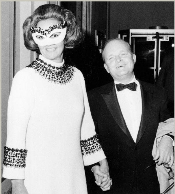
(Трумен Капоте и Катерина Грэхем )

Вечер, к которому Капоте готовился целый год, он посвятил Катерине Грэхем — самой влиятельной женщине Америки тех лет. Она дружила с Джоном и Джеки Кеннеди, Рональдом и Нэнси Рейган, Линдоном Джонсоном и Робертом МакНамара. Ей принадлежала печатная империя, в том числе The Washington Post и Newsweek. Она была медиахозяйкой страны, и, конечно, Трумен не мог пройти мимо. «Вокруг этой вечеринки кружился какой-то сумасшедший ажиотаж. И при этом какого-то более-менее разумного объяснения всему этому не было», — говорила Катерина Грэхем Vanity Fair в 1996 году.