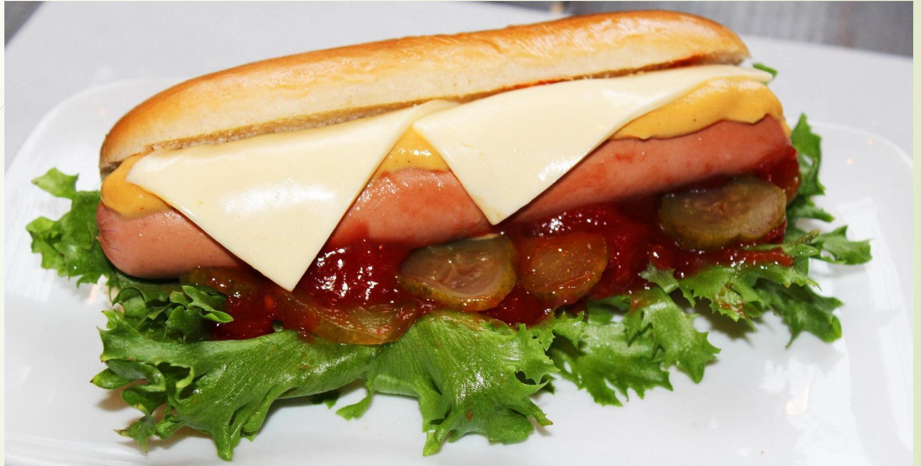
Нью-Йоркский хот дог с листьями салата, сыр, дольками маринованных огурцов, кетчуп и горчица (Цена 119 руб)