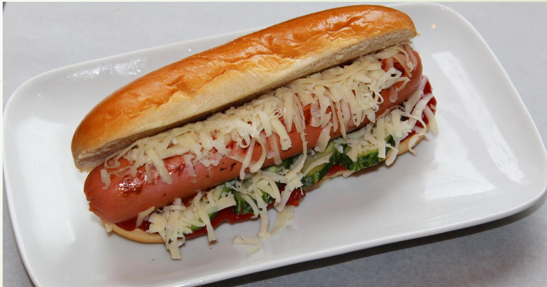
Чикагский дог свежие огурцы, кетчуп, горчица, тертый сыр. (Цена 109)