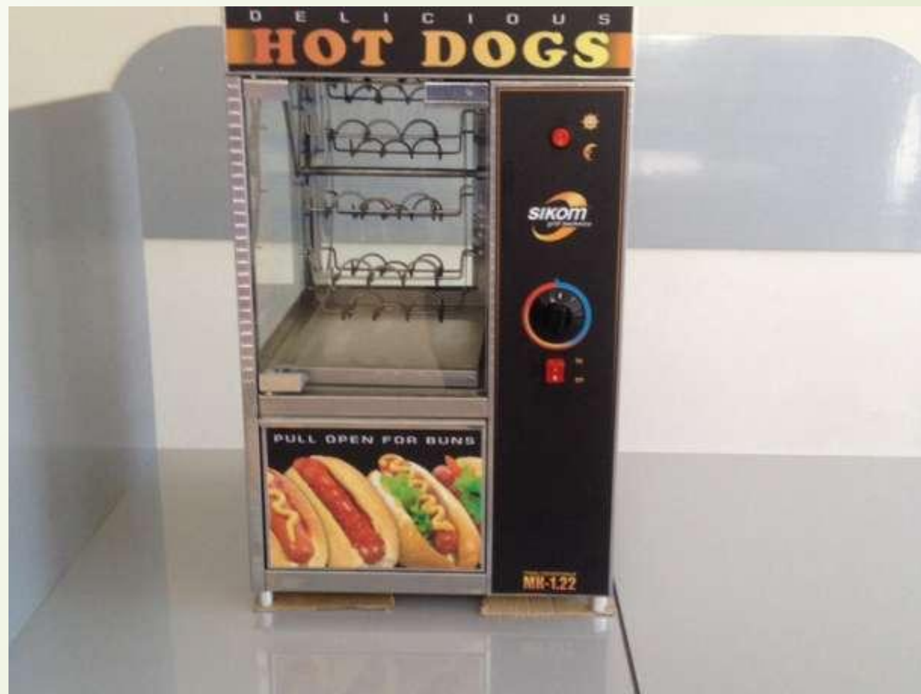
Гриль карусельный для хот-догов