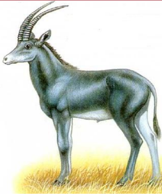
Голубая лошадиная антилопа