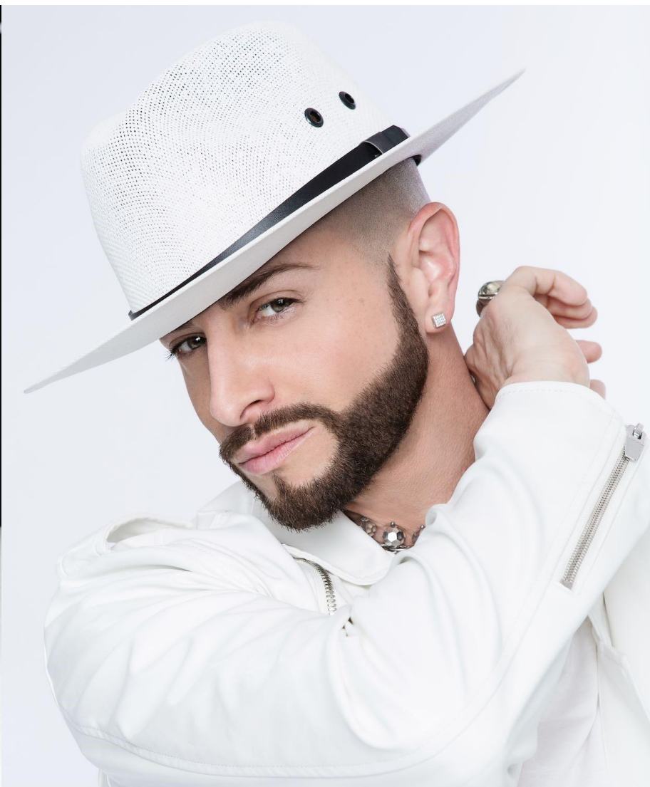
Брайан Фридман Brian Friedman