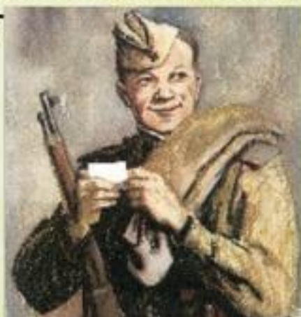
Портрет Тёркина. Клод Лоранс. 1943 г. Художник: О. Т. Бородин. 1943 г.

Тема войны – одна из центральных в творчестве Твардовского. Александр пишет о великом солдатском братстве, рождённом в годы испытаний. Великолепный образ Василия Тёркина сопровождал бойцов на фронтовых дорогах