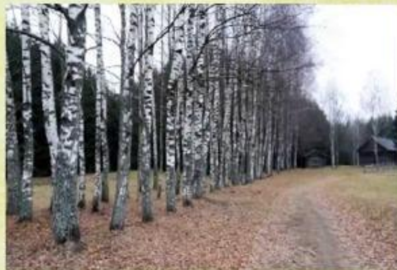
Хутор Загорье, восстановленный братьями поэта и дорога к хутору