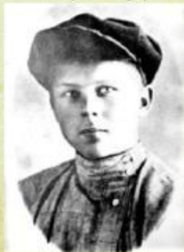
Александр Твардовский в детстве

Александр Трифонович Твардовский – одна из самых ярких и противоречивых фигур в русской литературе. Сын раскулаченного крестьянина, создатель произведения, ставшие классикой литературы социалистического реализма.