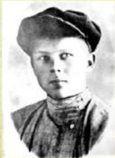
Александр Твардовский в детстве

Александр Трифонович Твардовский – одна из самых ярких и противоречивых фигур в русской литературе. Сын раскулаченного крестьянина, создатель произведения, ставшие классикой литературы социалистического реализма.