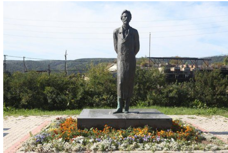
Памятник А.П. Чехову и Дом-музей А.П. Чехова в г. Ялте, памятник А.П. Чехову в Камергерском переулке в г. Москве, в г. Южно-Сахалинск