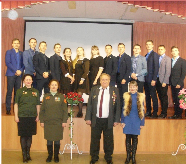
Встречами с ветеранами ВОО «Боевое братство»