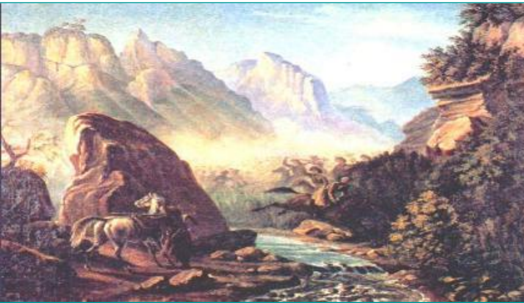
Перестрелка в горах Дагестана.

Во время Крымской войны Шамиль хотел опереться на англичан, но был отброшен в горные районы. Правящая верхушка имамата начала разорять простой народ бесконечными податями и военными поборами. Начались народные выступления против Шамиля.