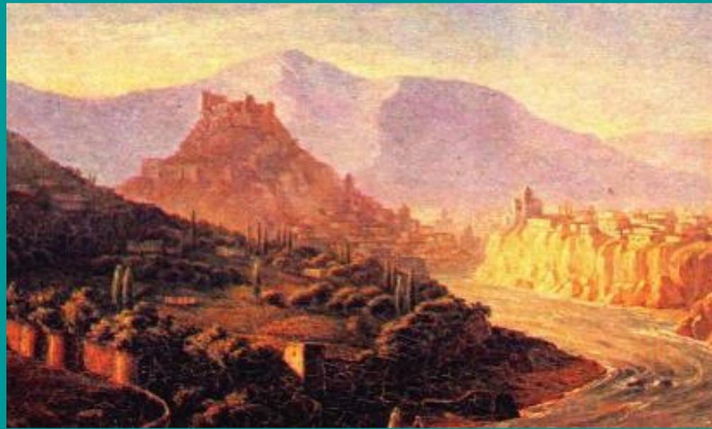
М.Ю.Лермонтов. Вид Тифлиса

Горцы – собирательное название, данное официальными властями различным народам Северного Кавказа