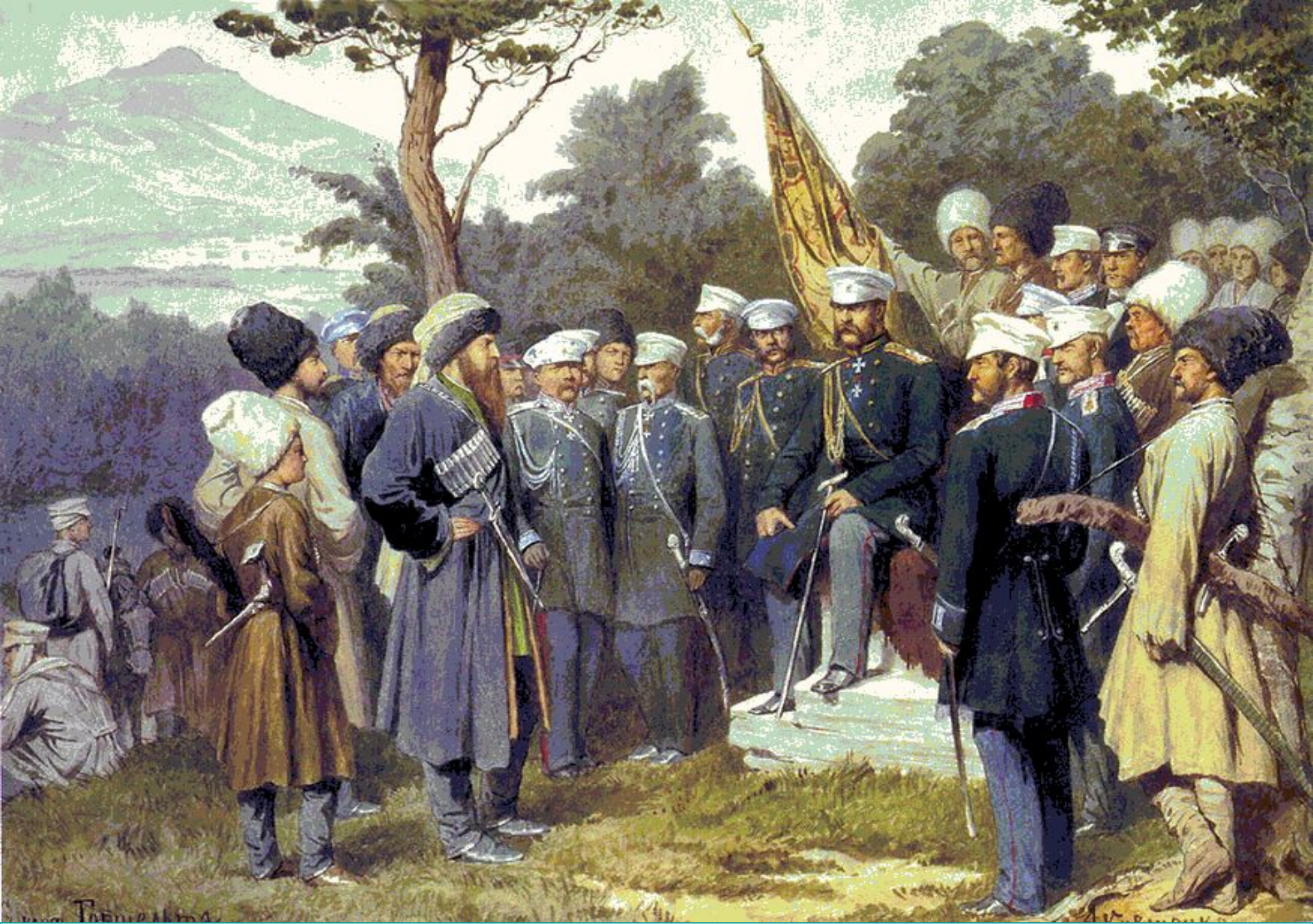
Сдача Шамиля князю Барятинскому. 1859 год.