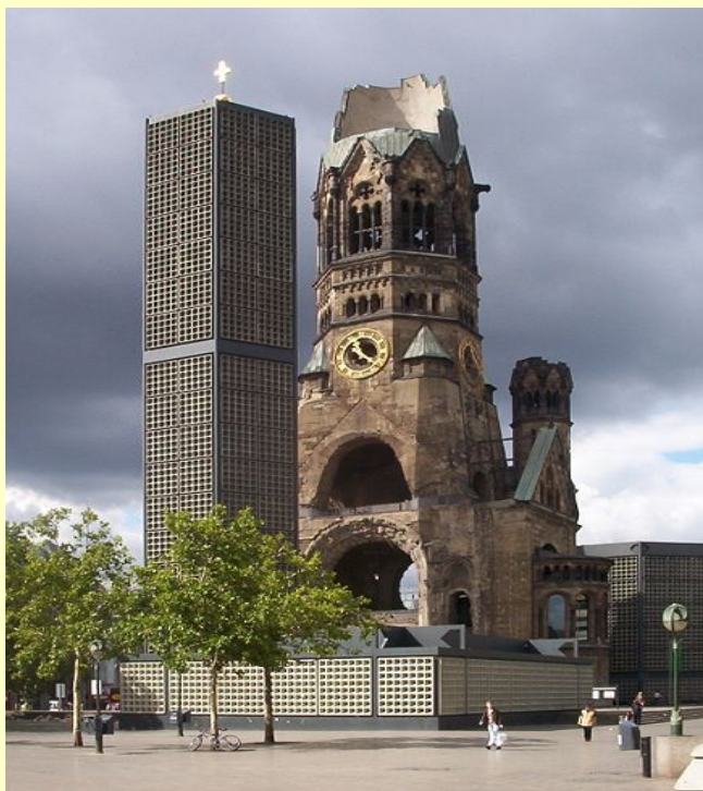
Мемориальная церковь кайзера Вильгельма в Берлине