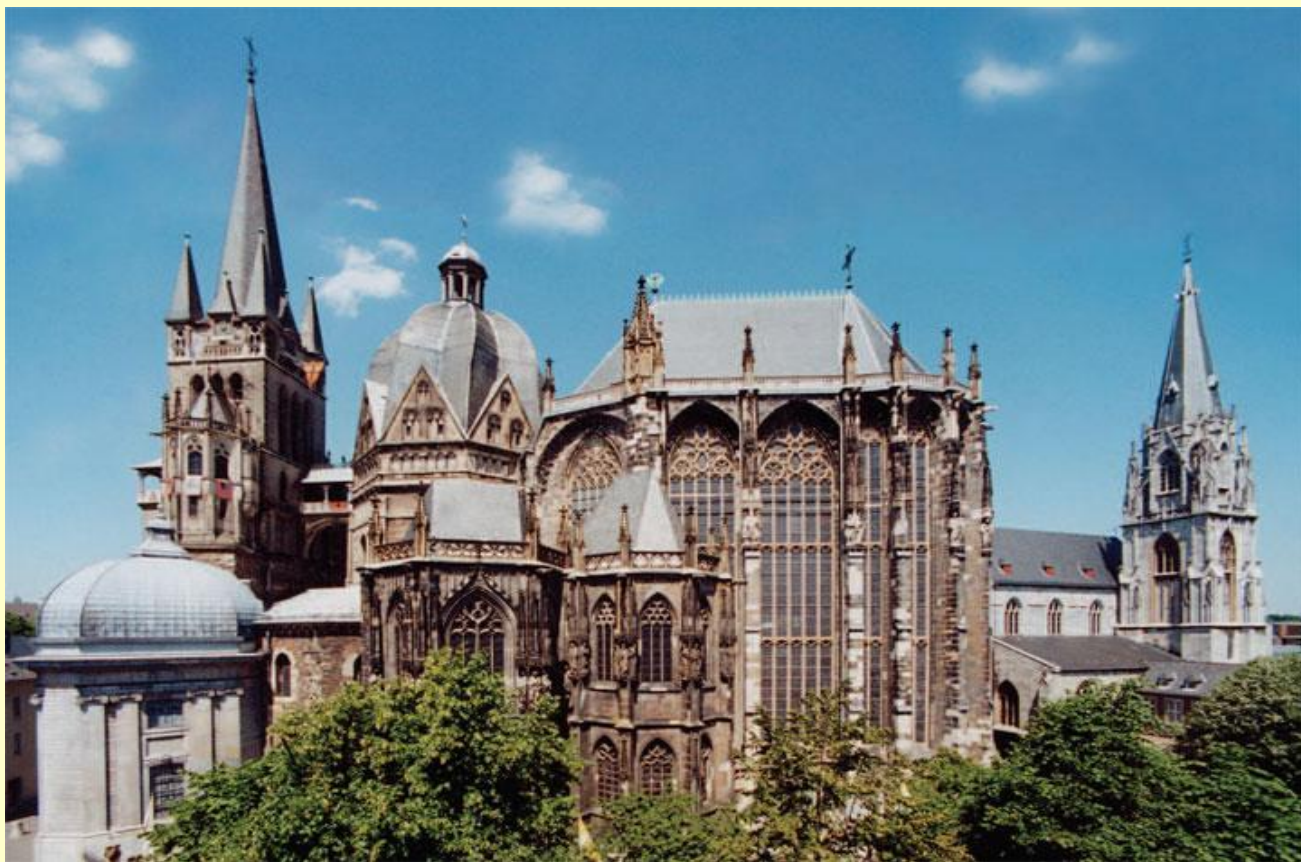
Ахенский кафедральный собор