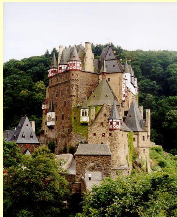
Замок Эльц на Мозеле (Рейнланд-Пфальц)