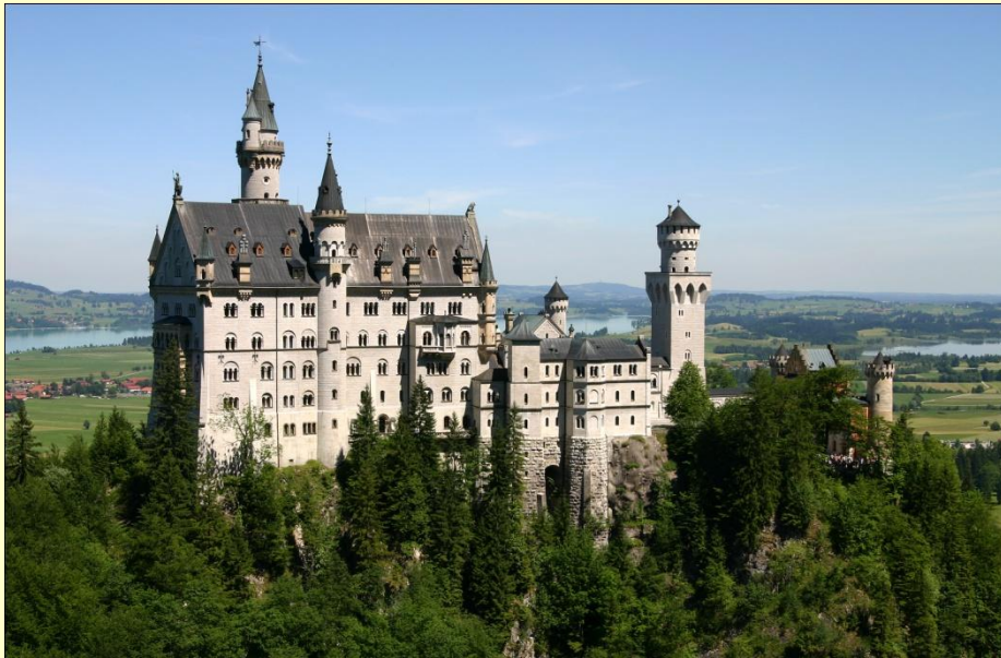
Королевский замок Нойшванштайн (Бавария)