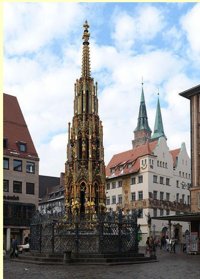
Красивый колодец в Нюрнберге