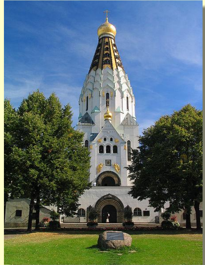
Храм-памятник русской славы в Лейпциге