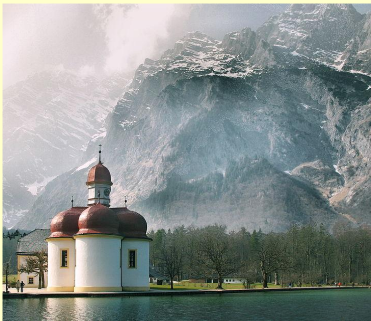
Церковь святого Варфоломея (Кёнигсзее)