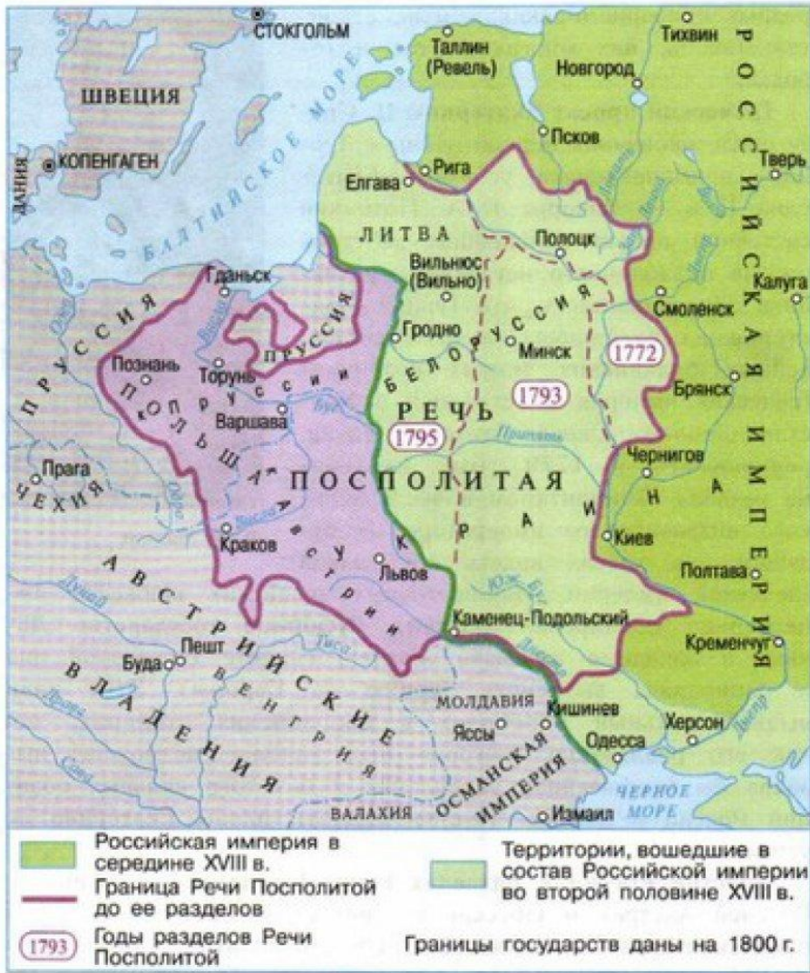
Разделы Речи Посполитой.

В 1794 Тадеус Костюшко поднял восстание. Повстанцы одержали несколько крупных побед. В 1794 году Суворов штурмом взял Прагу и вступил в польскую столицу. Восстание было подавлено. 1795 году произошёл последний раздел Польши