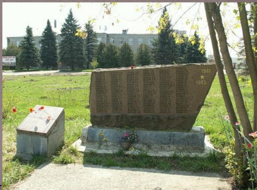
Памятники погибшим в годы ВОВ п. Редкино