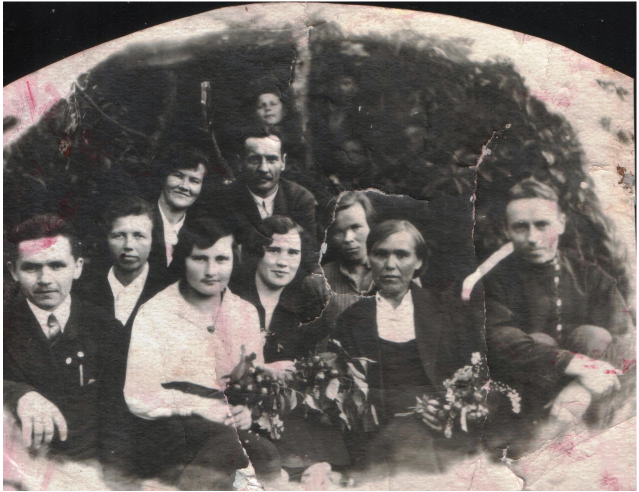
Учителя Нижнекулойской школы