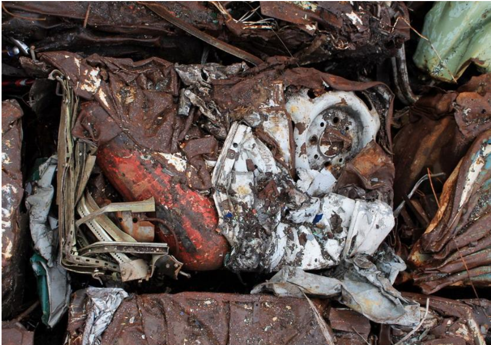
Пакет с впрессованным огнетушителем