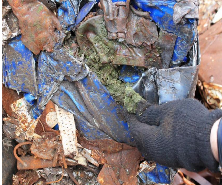
Лом с остатками химических веществ.