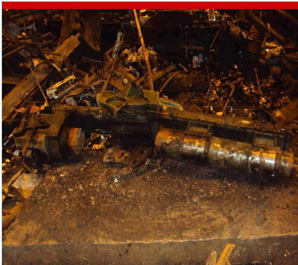
Часть 122-мм гаубицы Д-30А ( 2А18М )

Разделка и отгрузка металлолома, указанного в пп.6.2.1-6.2.5 (лом военного назначения), должны производиться отдельно от прочего лома.