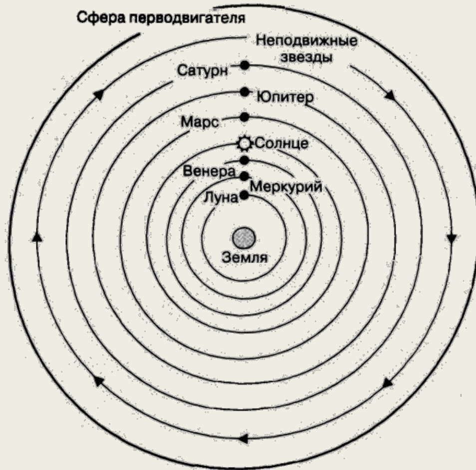
Вселенная по Аристотелю